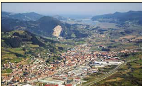
Takto viděly město posádky bombardérů.