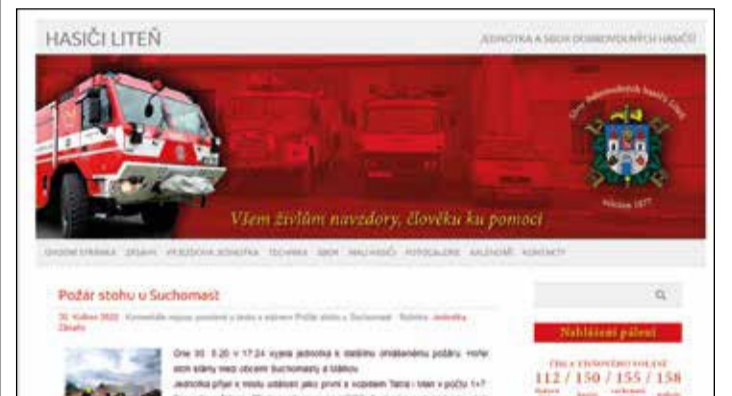
foto: úvodní strana webu

Dnes se za hasičskou webovou prezentací vypravíme do městyso Liteň v okrese Beroun ve Středočeském kraji. Žije zde přibližně 1 200 obyvatel. Jednotka sboru dobrovolných hasičů městyso Liteň spadá do kategorie JPO III/1, tzn., že zabezpečuje výjezd jednoho požárního družstva do 10 minut od vyhlášení poplachu. Svolání jednotky probíhá pomocí systému FIREPORT a sirény. Jednotka také zajišťuje požární ochranu pro okolní obce – Korno, Měňany a Nesvačily. Sbor dobrovolných hasičů Liteň byl založen v roce 1877 a je tak nejstarším činným sborem okresu Beroun. Sbor se aktivně podílí na kulturním dění v obci. Nejvýznamnější pořádanou akcí je Loučení s létem – zábavná akce pro děti i dospělé, zakončená večerním koncertem. V areálu bývalého statku každoročně hasiči pořádají oblíbené pálení čarodějnic. Od roku 1945 je sídlem sboru bývalá židovská synagoga na náměstí. V roce 2014 bylo v Litni založeno i družstvo mladých hasičů. Webové stránky hasičů z městyso Liteň, fungující na nezabezpečené doméně prvního rádu, se nám líbily. Obsahují vše podstatné – slovem i obrazem – z historie a současnosti sboru. Web umožňuje i přímé propojení se sociální sítí Facebook. Ocenili jsme úvodní heslo: Všem živlům navzdory, člověku ku pomoci. Specialitou webu je, že pro mladé hasiče používá důsledně milé označení malí hasiči. Jediná drobná výtka by snad mohla směřovat k častějším aktualizacím webu. Jinak dáváme palec nahoru!