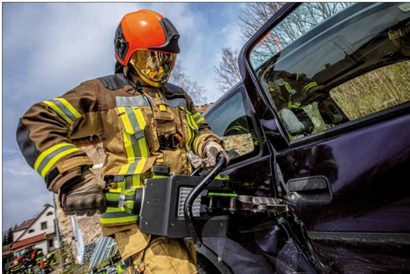
Moderní vybavení propůjčuje hasičům podobu kyborgů z vědecko-fantastických filmů.