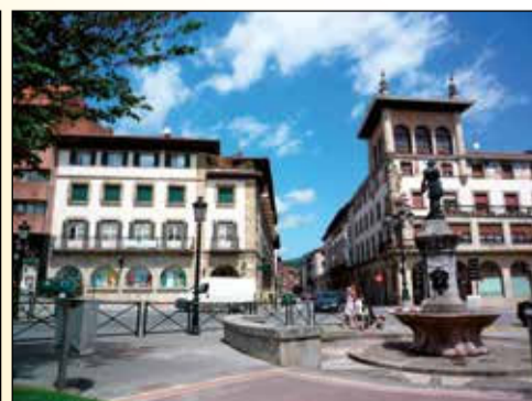
Zničená Guernica povstala z trosk.

Zároveň na jejich straně bojovali tzv. interbrigadisté z mnoha zemí Evropy včetně tehdejšího Československa. Jednalo se o dobrovolníky, kteří do Španělska přijeli bojovat proti fašizmu z osobněm Francovou osobou i veřejnou podporou nacistického Německa a fašistické Itálie tomuto armádnímu pučistovi.