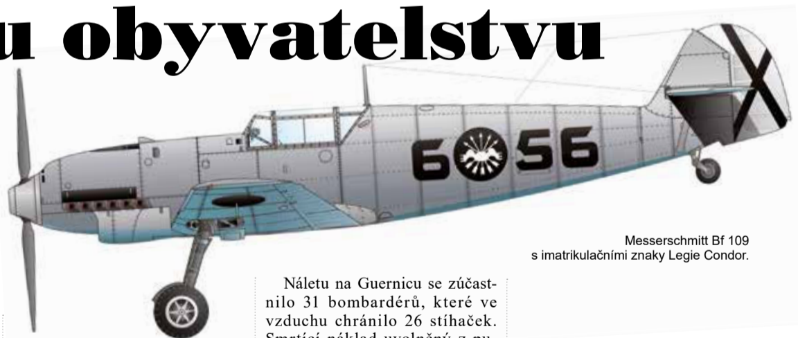
Messerschmitt Bf 109 s imatrikulačními znaky Legie Condor.

hlediska) most přes tamní řeku. Ten se však paradoxně nestal cílem ani jedné z vln leteckého útoku. Bombardování provedly letouny dobrovolnické německé Legie Kondor s podporou bombardérů italského letectva z jednotky Aviazione Legionaria. Němci a Italové podporovali boj generála Franca proti II. španělské republice. Na straně druhé, republikánské síly se těšily podpoře Sovětského svazu.