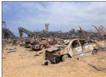
Za obětí výbuchu padlo i množství automobilů.