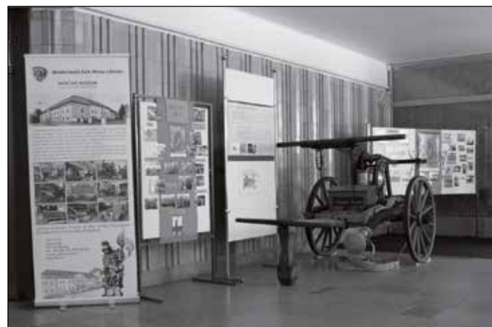
Kdo jedná v sále, to bylo jasné i při pohledu do předsálí.