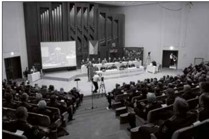
Pohled do sjezdového sálu.