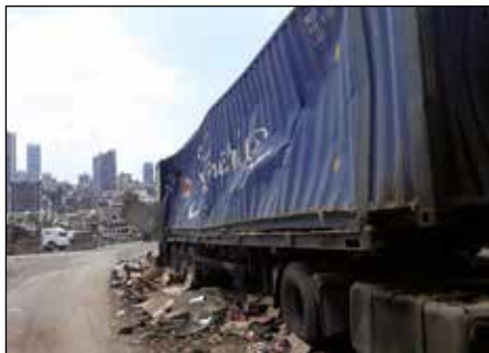
Dopravní trasy byly zničeny.

připravil Mirek Brát, foto archiv Petra Vodičky (snímky za zásahu v libanonském Bejrútu)