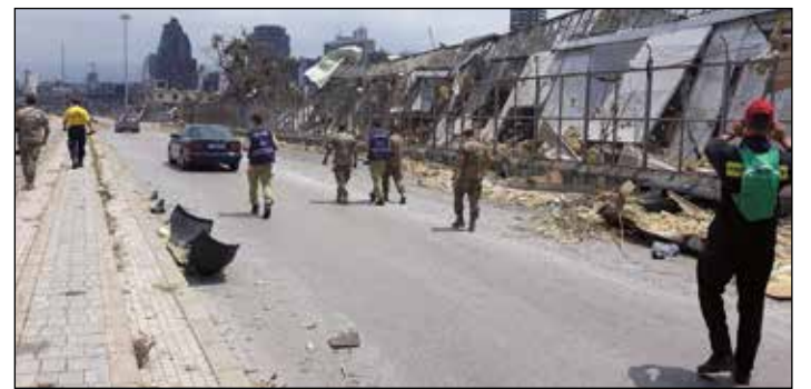
V Bejrútu byla vážně poničena rozsáhlá část městské infrastruktury.

Uvedení odřadu USAR do pohotovosti provádí na pokyn řídicího důstojníka operační a informační středisko MV – generálního ředitelství HZS ČR po obdržení informace o vzniku závažné mimořádné události v zahraničí nebo při vyžádání pomoci ze zahraničí. Po upřesnění jmenného seznamu zajišťuje řídicí důstojník vydání rozkazu generálního ředitele HZS ČR k povolání příslušníků k pracovní cestě k plnění mimořádných úkolů HZS ČR, kterým se určí velitel odřadu, zařadí do odřadu osoby poskytující pomoc, stanoví cíl a způsob přepravy, místo soustředění, doba odjezdu a další náležitosti. Svoz příslušníků nebo