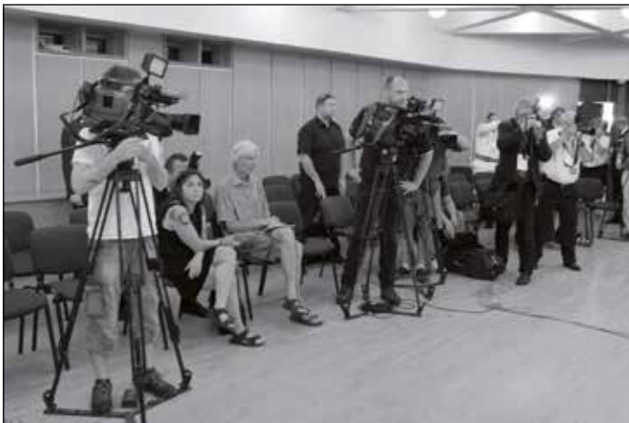
Sjezd proběhl za velkého zájmu médií.