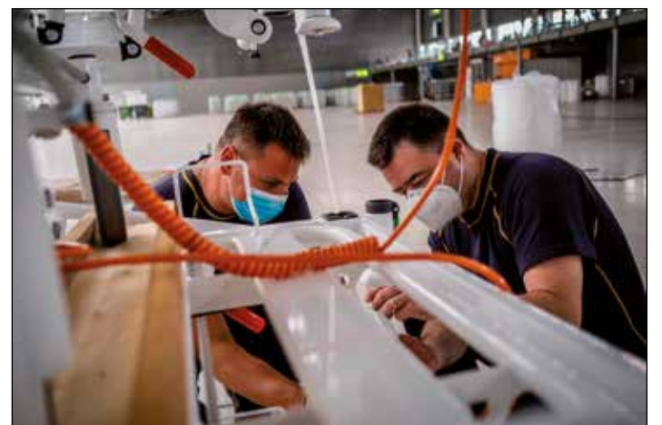
Dobrovolní a profesionální hasiči se zapojili do příprav odvozu lůžek z provizorní nemocnice na brněnském Výstavišti. V areálu provizorní nemocnice bylo připraveno 302 lůžek, které putují do skladu Státních hmotných rezerv. Před odvozem však musí být každé lůžko vážící dle typu od 80 do 120 kg demontováno do přepravní polohy, zabaleno a naloženo do vozidla.