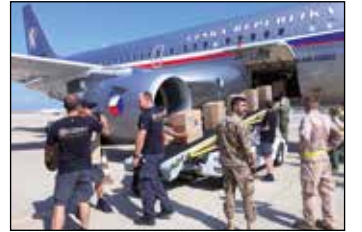
Vykládka materiálu z letadla.

kynologů na místo soustředění k vyslání odřadu je zajišťován HZS krajů, případně ve spolupráci s Policií ČR na základě rozhodnutí řídicího důstojníka MV-generálního ředitelství HZS ČR. Současně s uvedením odřadu do pohotovosti je ve spolupráci s Ministerstvem zahraničních věcí a odborem mezinárodní spolupráce MV zjišťována: situace v místě nasazení, požadavky na pomoc, kontakty na kompetentní orgány postižené země, její zastupitelský úřad v ČR a náš zastupitelský úřad v postižené zemi, rychlý průjezd tranzitními zeměmi, nutnost zajištění víz. Při letecké přípravě je třeba s kompetentními