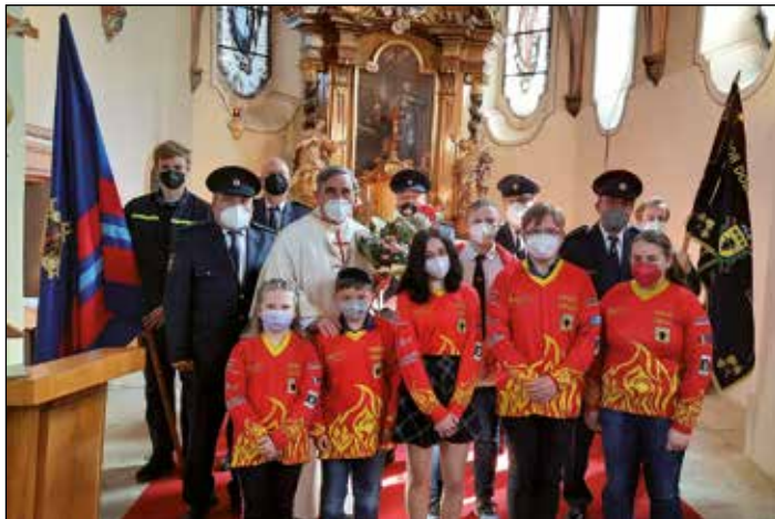
Mše k uctění sv. Floriána