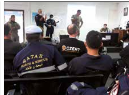
Mezinárodní záchrannářský brífink.