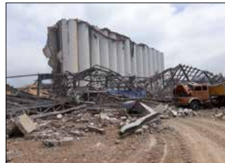
Zničené sílo v Bejrútu v roce 1967 postavila firma z Pardubic.