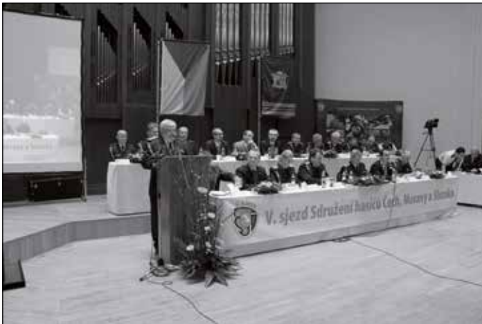
V Domě hudby byla výborná akustika.