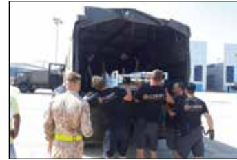
Důležitá součást logistiky – nákladní automobil.