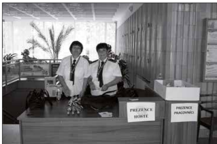
Usměvavá i efektivní, taková byla sjezdová prezence.