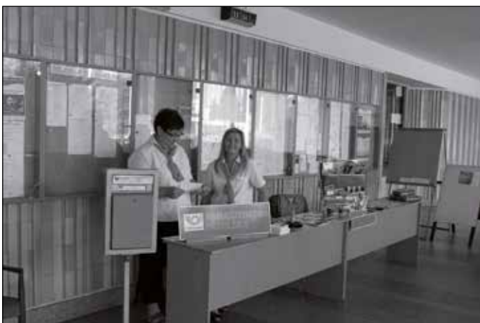
K dispozici byla příležitostná přepážka České pošty, s.p.