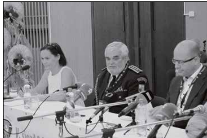
Hostem sjezdu byl i tehdejší předseda vlády ČR Bohuslav Sobotka.