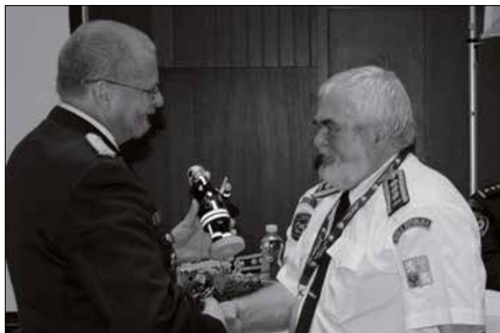
Oficiální i osobní, taková byla setkání na V. sjezdu SH ČMS.

organizací sousedních zemí, se kterými SH ČMS udržuje velmi dobré vztahy. V okamžiku V. sjezdu mělo Sdružení hasičů Čech, Moravy a Slezska celkem 348 481 členů v 7783 sborech. Z toho ve věku 6–18 let bylo 50 248 členů. 70 503 dobrovolných hasičů bylo zapojeno v 7077 jednotkách požární ochrany obcí a 144 JPO podniků.