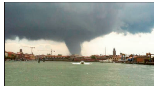
Benátky ohrožují i větrná tornáda.