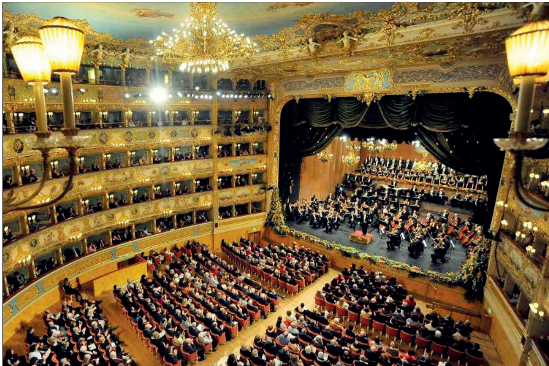
Impozantní interiér divadla La Fenice.

Kdysi námořní a obchodní velmoc a středisko sklářství, mají Benátky dodnes velký historický, kulturní, společenský i administrativní význam. Od roku 1987 jsou Benátky s okolní lagunou památkou UNESCO. Požáry Benátky ohrožovaly v dávné minulosti, riziku ničivého ohnivého živlu čelí město dodnes.