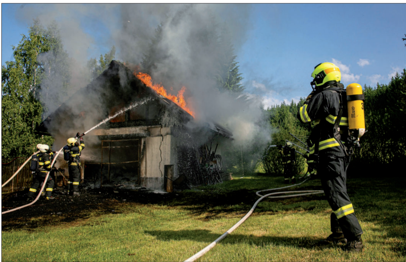
V letním období neohrožuje hasiče jen žár sálající z ohně, ale i panující venkovní teploty. Riziko přehřátí lidského organismu je zde velmi vysoké. foto mf

JSDH Ždírec nad Doubravou (ze zdroje portálu pozary.cz )