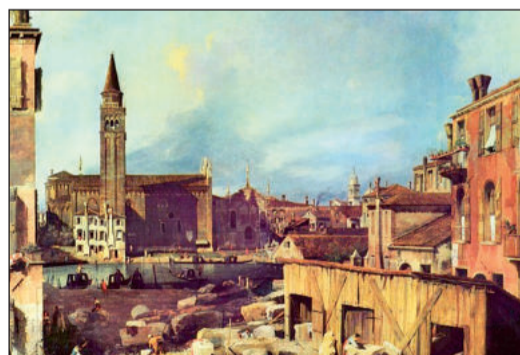
Divadlo vzniklo na místě rodného domu Marka Pola.