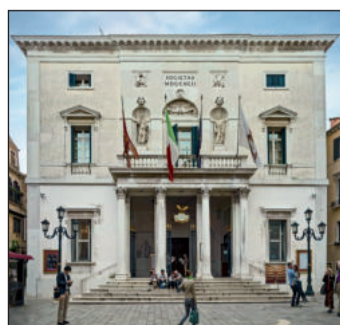
Vstup do divadla La Fenice.