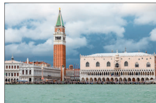
Benátky jsou na seznamu památek UNESCO.