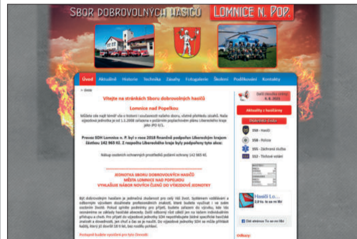
Úvodní strana webu

V dnešním čísle Hasičských novin se za webovou prezentací vypravíme do Lomnice nad Popelkou v Libereckém kraji. Hasičská historie zde začíná již v 19. století, kdy byla 22. srpna 1872 svolána ustavující schůze, na níž byl založen hasičský sbor jako odbor TJ Sokol v Lomnici nad Popelkou. Přihlásilo se 45 občanů, kteří zároveň složili slib. Při dalších schůzích se sbor rozšířil na 62 členů. V roce 1875 měl hasičský odbor TJ Sokol 76 činných členů. Jejich stejnojmenný byl oblek z rezného plátna, u požáru se užívala přilba s koženou ochranou. Od roku 1897 jsou hasiči vedeni jako samostatný sbor, jsou vydány stanovy, jenž jsou potvrzeny městským úřadem. V roce 1899 byla slavnostně otevřena nová hasičská zbrojnice u zámku. V roce 1982 proběhla oslava 110. výročí založení hasičského sboru. A konečně v roce 2012 vzniká webová prezentace zdejších hasičů. Funguje na nezabezpečené doméně prvního řádu. Zaujaly nás na ní například odkazy: Aktuality z hasičárny či Poděkování. Nechybí ani datum aktuální zkoušky sirény. Web hasičů z Lomnice nad Popelkou nabízí vše podstatné pro seznámení se sborem i jednotkou: historii, zásahy, používanou techniku, fotogalerie atd. Samozřejmostí je možnost vstupu na facebook stránku z webu. Stránky jsou i hojně navštěvovány, jak jsme zjistili z připojeného počítačového. Pokud eviduje opravdu unikátní IP adresy, pak návštěv od roku 2012 do srpna 2021 bylo více než 161 000. Gratulujeme!