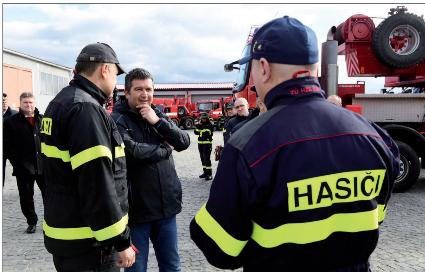
Ministr vnitra Jan Hamáček s hasiči.

S přátelským pozdravem Váš ministr vnitra Jan Hamáček