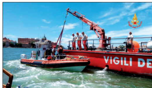
Hasiči v Benátkách jsou častěji na vodě než na pevné zemi.