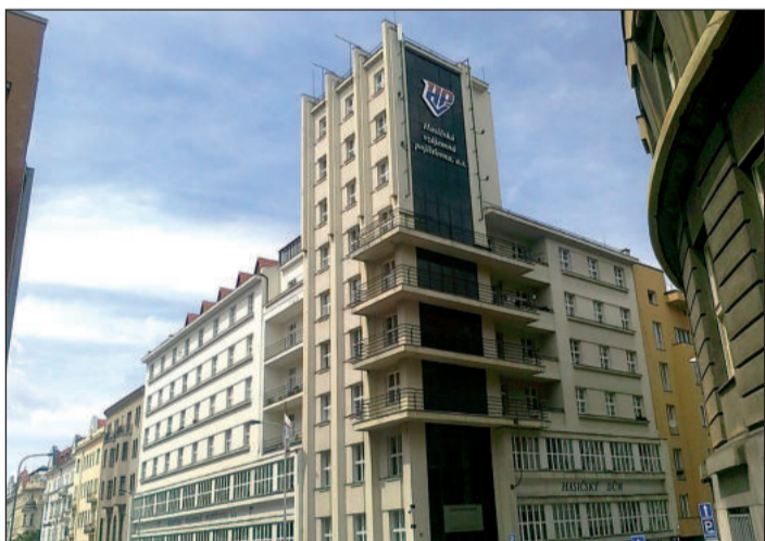
Hasičský dům na adrese Řimská 2135/45, Praha 2 se v sobotu 7. 8. otevře veřejnosti v rámci akce Open House Praha 2021.

Funkcionalistická budova, jejíž stavba je datována do druhé poloviny 30. let minulého století, bude zpřístupněna prostřednictvím komentovaných prohlídek, kdy velikost jedné skupiny činí max. 10 osob. Tyto skupiny bude průvodce odbavovat a provázet postupně během celé otevírací doby. Sedmý ročník festivalu Open House Praha (v termínu 2.–8. srpna 2021) zpřístupňuje zdarma 80 budov. Festivalový týden nabízí řadu doprovodných programů. Dodejme, že Hasičský dům na Vinohradech se měl stát chloubou české hasičské organizace, málem však znamenal její zánik. Jeho stavbu i dokončení totiž provázela řada finančních potíží. Hasiči si museli půjčit od bank a dary po-