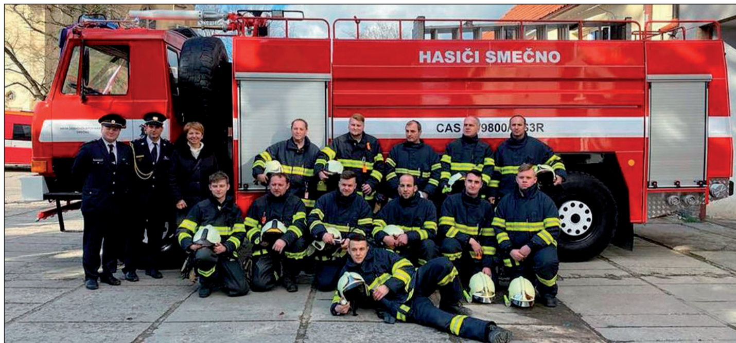
Sbor dobrovolných hasičů Smečno (Středočeský kraj) si v letošním roce připomíná 145 let od svého založení. Aktuálně čítá SDH Smečno okolo 18 aktivních členů, kteří působí rovněž ve výjezdové jednotce. Hasičské noviny se připojují ke gratulantům!

(poznámka redakce: Hasičské noviny č. 15 vycházejí dne 6. srpna, předem se omlouváme našim čtenářům, kteří z technických důvodů obdrželi noviny na předplatné v termínu po akci popisované v řádcích výše. Z tohoto důvodu jsme prezentovali pozvánku na možnost prohlídek Hasičského domu v Praze i na FB Hasičských novin)