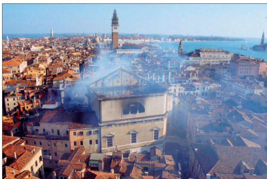
Požár divadla byl katastrofou pro jednu ze stavebních ikon města na laguně.

Připravil Mirek Brát