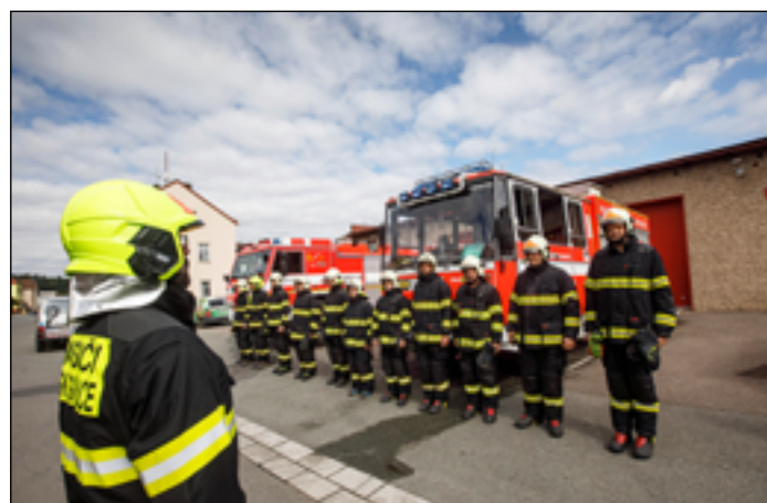
Vyjetí techniky, nástup v zásahových oblecích.

z hasičů utrpěl vážná zranění, kterým i přes veškerou snahu zasahujících kolegů podlehl. Na místo byly okamžitě vyslány další jednotky dobrovolných a profesionálních hasičů z blízkého okolí, které ihned zahájily odklizení sutin rodinného domu, protože bylo nahlášeno, že se jeden ze zasahujících hasičů nachází pod troskami budovy. Velitel zásahu si na místo povolal psy vycvičené pro vyhledávání