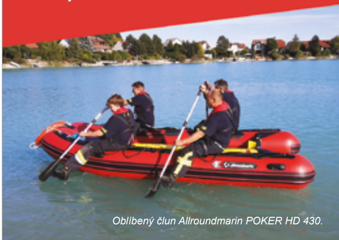
Oblíbený člun Allroundmarin POKER HD 430.

Mezi oblíbená plavidla mezi záchranáři patří i robustní nafukovací čluny, které mají skvělé jízdní vlastnosti a mobilitu.