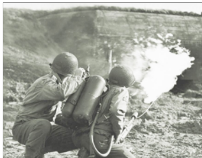
Vojenský plamenomet v akci