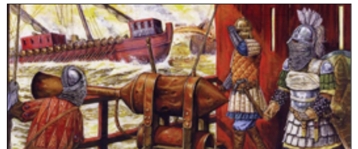
Vrhač řeckého ohně ve fantazii kreslíře.