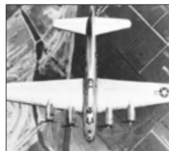
Dole jsou Drážďany...