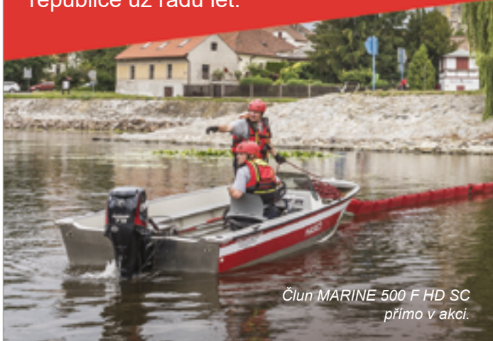
Člun MARINE 500 F HD SC přímo v akci.

Tradiční nýtované hliníkové čluny MARINE pomáhají záchranným složkám po celé republice už řadu let.