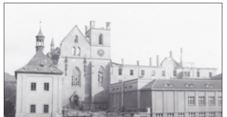
V roce 1945 byla zápalnými pumami bombardována i Praha

pýr – záškodník by měl na zádech miniaturní batůžek s napalmem a časovačem. Předpokládalo se, že letka amerických netopýřů si v Japonsku začne hledat nový domov a zahnízdí se. Časovače napalmoných náloží se pak měly postarat o moře požárů v půdních prostorách apod. Při zkouškách se ovšem netopýři ukázali jako málo odpovědní vojáci (nelze se jim ani divit, když uvážíme, že měli vyrazit na sebevražednou misi) a zapálili americkou základnu. Projekt nakonec nebyl realizován.