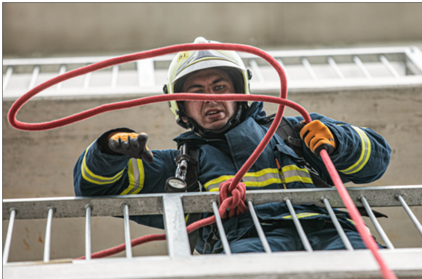
Práce s lanem je důležitá zejména při zásazích ve výškách. Snímek z jedné ze soutěží o nejtvrďšího hasiče mezi profesionály i dobrovolníky.