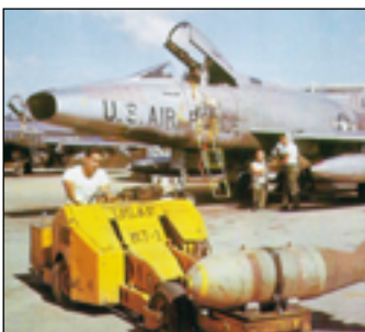
Nakládku pum s napalmem