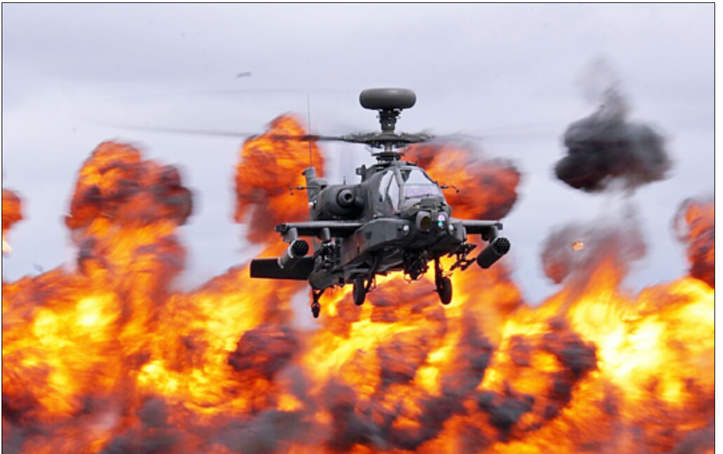
Vrtulník před stěnou hořícího napalmu

Původně nebylo posláním napalmu ničít živé cíle či bojovou techniku protivníka. Měla to být civilní substance pro bezpečné a šetrné vypalování trávy. Válečná léta však našla pro napalm rychlé využití jako náplně pro zápalné pumy. Při spojeneckém náletu na sklouknu války, jehož cílem byly saské Drážďany, byla polovina svržených pum naplněna napalmem. Zápalné pumy svrhlo omylem na Prahu americké letectvo v roce 1945. Pumy se zápalným účinkem používalo i nacistické Německo, a to s náplněmi dvou typů. První byly na bázi hořčičku a hliníku, druhý typ byl naplněn hořlavou