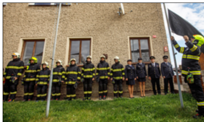
Vztyčení černé vlajky.

hasičů minutou ticha. Rekapitulace tragické události v Koryčanech: Dne 15. září 2021 přijalo krajské operační středisko hasičů událost o narušení plynového potrubí v rodinném domě v Koryčanech na Kroměřížsku. Na místo vyjela místní dobrovolná jednotka hasičů a profesionální hasiči z Morkovic-Slížan a Kroměříže. V době příjezdu dobrovolné jednotky došlo k výbuchu, při kterém byli zraněni 4 hasiči a 2 civilní osoby. Jeden