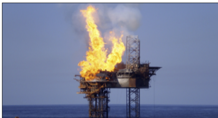
Požár ropné plošiny může být začátkem ekologické katastrofy.