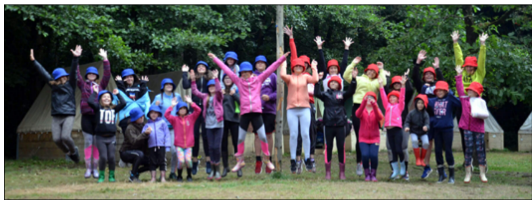
Kdo neskáče, není hasič!

Od roku 2013 pořádají prázdninové hasičské soustředění, nejčastějším zázemím je již několik let Peklo nad Zdobnicí. Děti si během týdne užijí sportovních tréninků, soutěží i kultury. Jak vedoucí zdůrazňuje, realizace by nebyla možná bez významné pomoci členů sboru, vedoucích, obce, rodičů