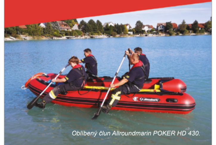
Oblíbený člun Allroundmarin POKER HD 430.

Mezi oblíbená plavidla mezi záchranáři patří i robustní nafukovací čluny, které mají skvělé jízdní vlastnosti a mobilitu.