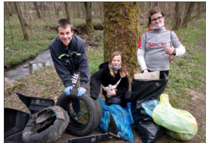
Člověk by se podivil, co všechno se dá v lese nalézt...

Koncem školního roku děti radně trénovaly požární útok a bylo