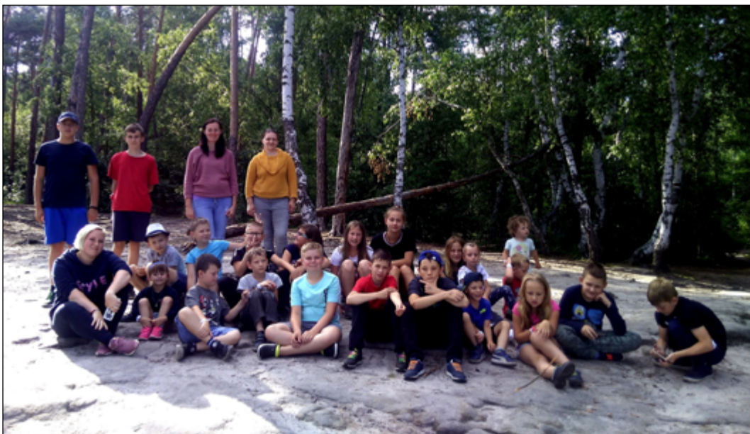
Mladí hasiči se svými vedoucími.

Věra Nutilová, foto: MH Sloup, MH Sloup, uklidme Česko