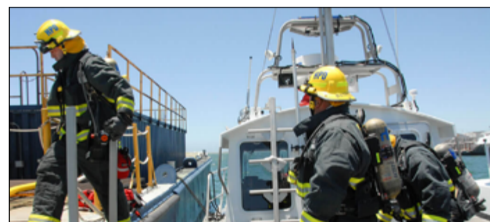
Hasiči na moři mění automobilovou cisternu za spolehlivý člun.