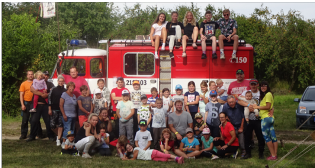
Společné foto do hasičského památníku.