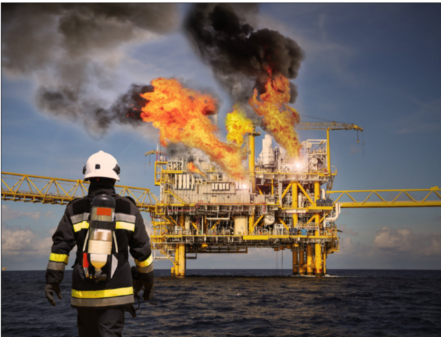
Hasiči schopní zásahu při požáru na těžební plošině musí projít speciálním výcvikem.

Ačkoli jsou požáry na moderních ropných plošinách relativně vzácné, pokud se přeci jen plameny objeví, důsledky požáru bývají často tragické. Nejúčinnější nástroj pro vyhnání „červeného kohouta“ z plošiny, představují v současnosti pěnové systémy se stlačeným vzduchem. Oheň, který v minulosti zničil ropné plošiny Piper Alpha a Deepwater (těmto událostem se podrobněji věnujeme níže), ukázal důležitost funkčních automatizovaných bezpečnostních systémů pro detekci a hašení požáru. V případě požáru na ropné plošině je, kromě samotného hašení, důležitá i evakuace. Záchrana lidí z plošiny se obvykle provádí pomocí rychlých člunů nebo vrtulníků. Limitujícím pro nasazení těchto záchranných prostředků je samozřejmě počasí. Například při výšce vln přesahujících tři a půl metru je záchrana osob z hořící plošiny pomocí hladinových prostředků více než problematická. Silný vítr rovněž komplikuje nasazení vrtulníků. Při selhání plánovaných hromadných evakuačních postupů jsou pak poslední šanci na záchranu z hořící plošiny prostředky individuální evakuace zahrnující šplhací sítě, lana či únikové skluzy. V tomto případě se ovšem lidé dostávají do vody s minimem ochranných prostředků. Jejich šance na přežití se v rozbořeném či chladném moři výrazně snižuje.