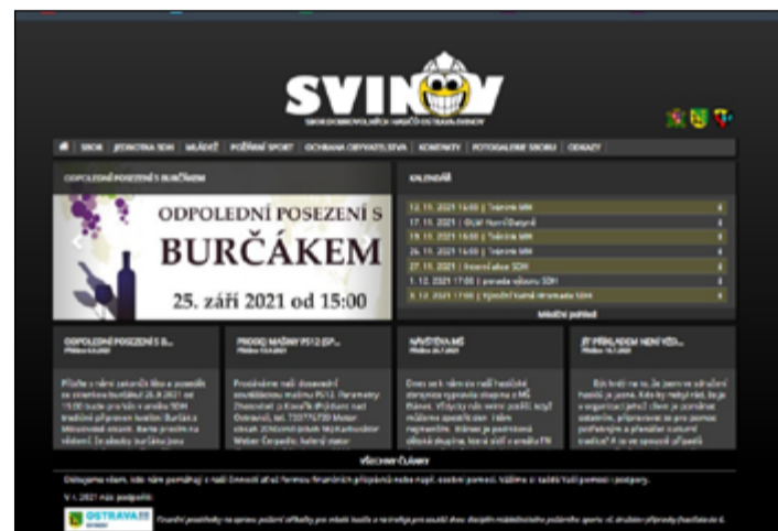
Úvodní strana webu