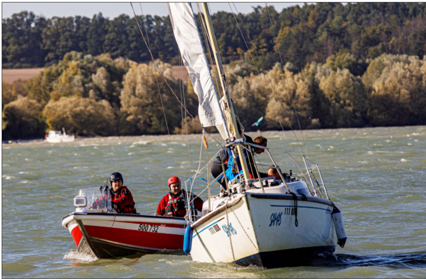
Hasiči si musí umět poradit i při zásahu na vodní hladině.