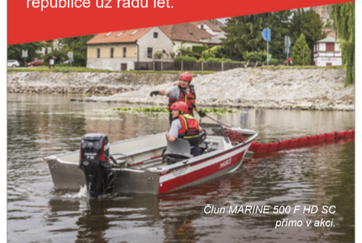
Člun MARINE 500 F HD SC přímo v akci.

Tradiční nýtované hliníkové čluny MARINE pomáhají záchranným složkám po celé republice už řadu let.