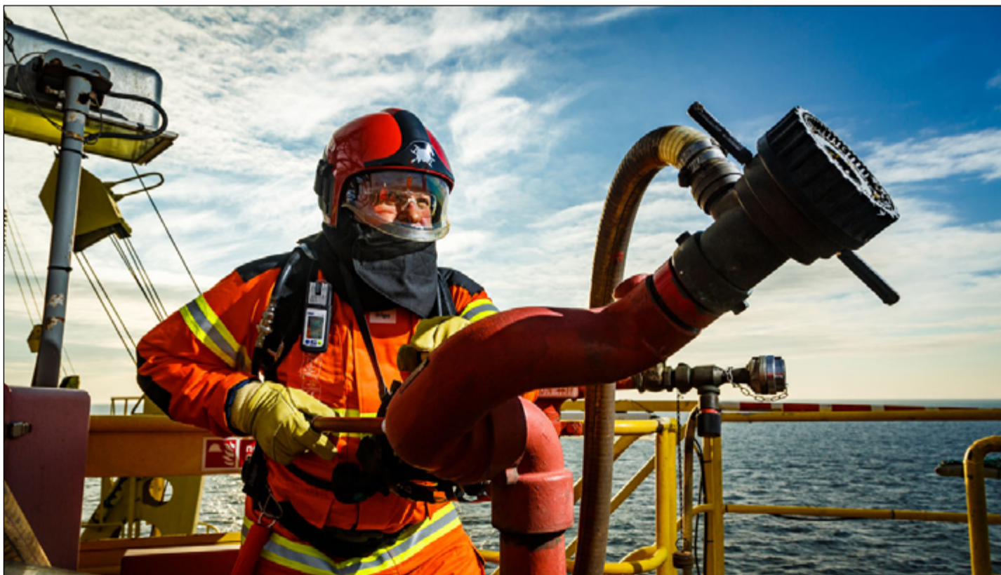
Hasiči na ropných plošinách musí doufat v nejlepší, ale být připraveni na nejhorší...

připravil Mirek Brát, zdroje foto via wiki, youtube, flickr, pinterest