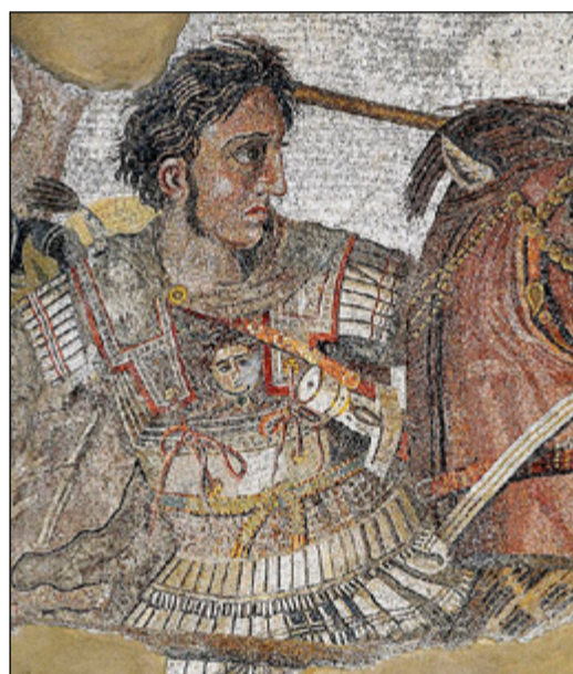
Podobně jako Cortés kdysi reagoval i Alexandr Veliký.