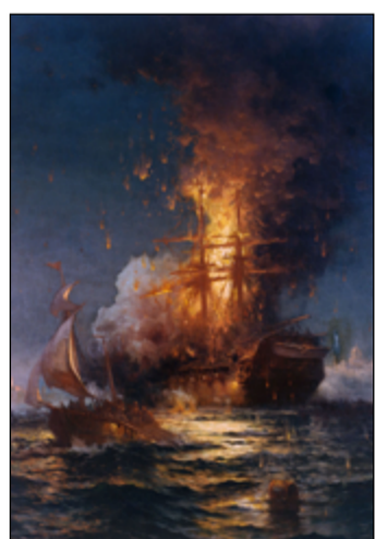
Požár španělské galeony.