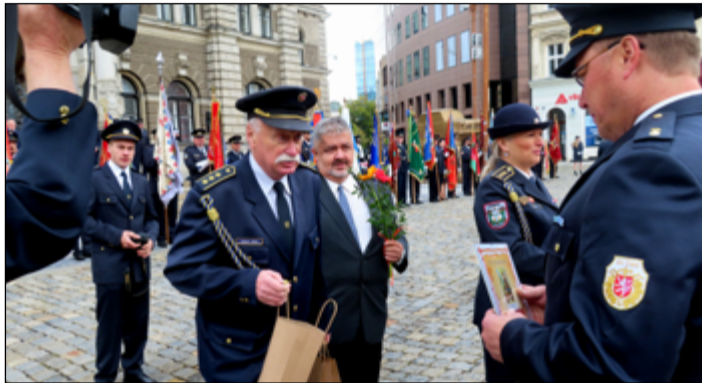
Akce byla veřejným poděkováním dobrovolným hasičům.

V polovině října se uskutečnila největší letošní akce dobrovolných hasičů okresu Liberec. Účelem bylo poděkovat veřejně dobrovolným hasičům nejen za stálou připravenost na pomoc při mimořádných událostech, ale také za jejich pomoc obcím a společnosti v uplynulém období v boji s covidem. Hasičské jednotky a sbory pomáhaly s distribucí ochranných roušek, prováděly plošnou dezinfekci veřejných prostor a pomáhaly zejména obcím při dalších akcích souvisejících s bojem proti Covid-19.