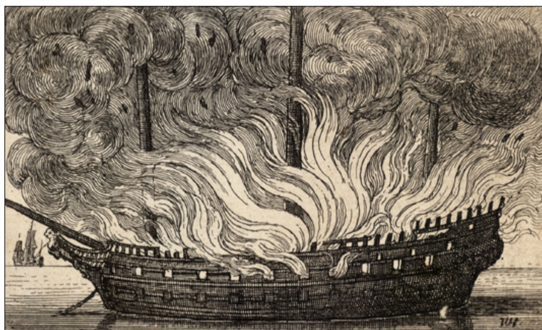
Hořící loď na rytině českého barokního umělce Václava Hollara.