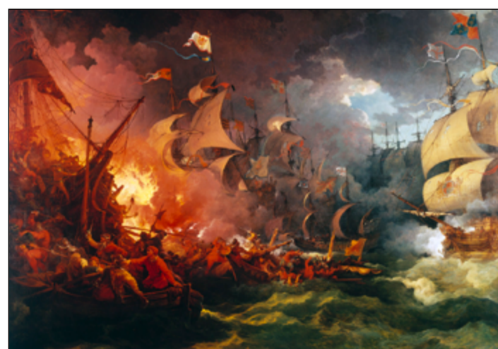
Motiv moře a ohně vždy fascinoval výtvarné umělce.