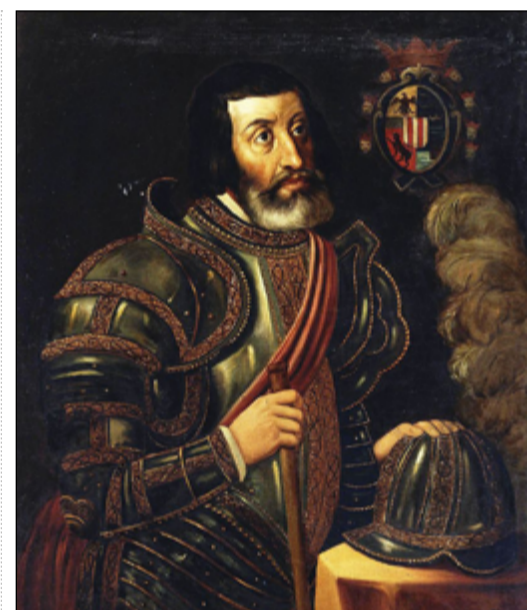
Hernán Cortés: muž, který se nebál riskovat.