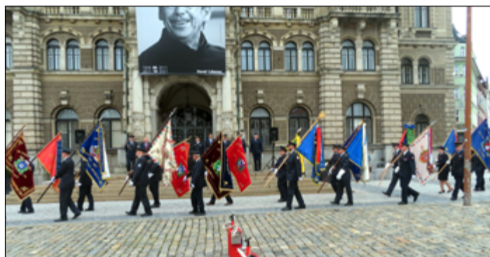
Defilé hasičských praporů v centru Liberce.