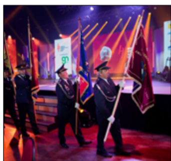
Nechyběly hasičské prapory.

Zapojení se do boje s šířením nemoci covid-19, pomoc při povodních, tornádu nebo i osamocným a nemocným lidem, to vše byly zásahy a činnosti, se kterými se přihlásili letošní finalisté do 11. ročníku ankety. O titul Jednotka nebo Sbor dobrovolných hasičů roku se ucházelo 120 zájemců z celé České republiky. Padesáti z nich pak veřejnost poslala rekordních téměř 58 tisíc hlasů, na základě kterých vzešlo jejich výsledné pořadí. Finanční dary a záchranářskou techniku v celkové hodnotě přesahující 2 400 000 Kč obdrží oceňování finalisté na prvních třech místech díky partnerům Ankety, jimiž jsou: společnosti GasNet, generální partner, hlav-