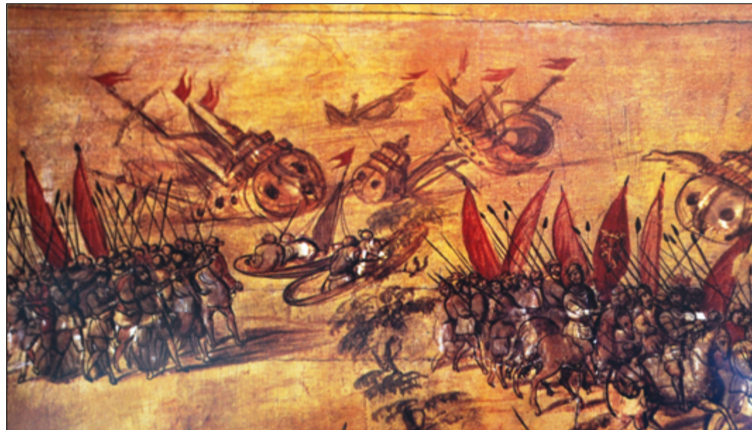
Dobové vyobrazení spálení španělských lodí.

Před útokem na Aztéckou říši se Cortés odhodlal k radikálnímu kroku. Nechal spálit deset z celkem jedenácti lodí. Ušetřené plavidlo odplulo předat zprávu do Španělska. Ponechme nyní stranou další osudy konkvistadora a zaměřme se právě na čin spálení vlastního loďstva. V prvé řadě zde musíme odmítnout mýtus, že Cortés nechal lodě spálit. Plavidla nebyla spálena, ale potopena. Jejich pozůstatky se nyní snaží najít a identifikovat podvodní archeologové. Dalším oblíbeným mýtem je původnost a originalita Cortésova jednání, kterým chtěl zvýšit motivaci a odhodlanost nepočetné hrstky dobrodruhů, která zbraněmi drze klepala na pomyslné brány ohromné a lidnaté Aztécké říše. Cortés byl vzdělaný a na svou dobu možná i sečtělý, vždyť mohl pracovat i jako notář!