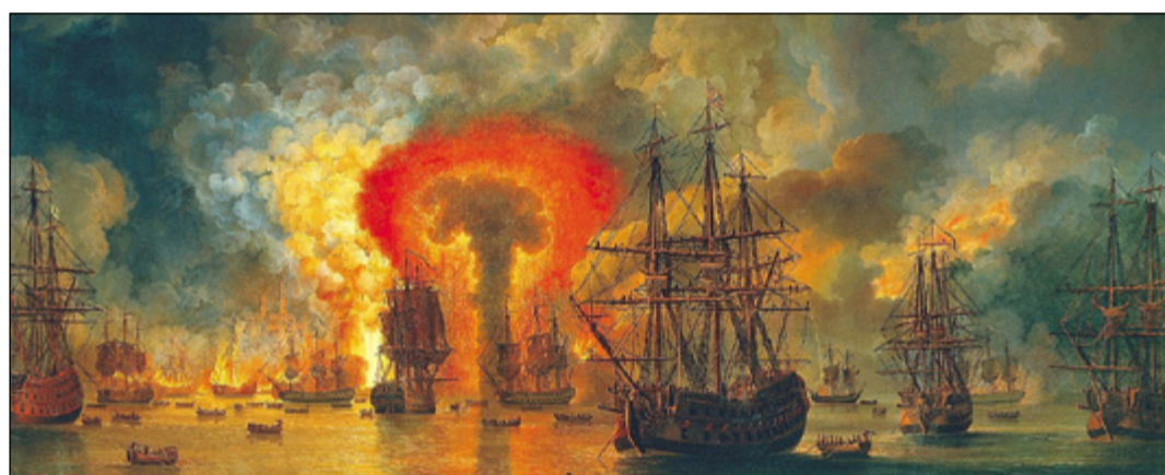
Hořící lodě mohou někdy být totéž co "spálené mosty".