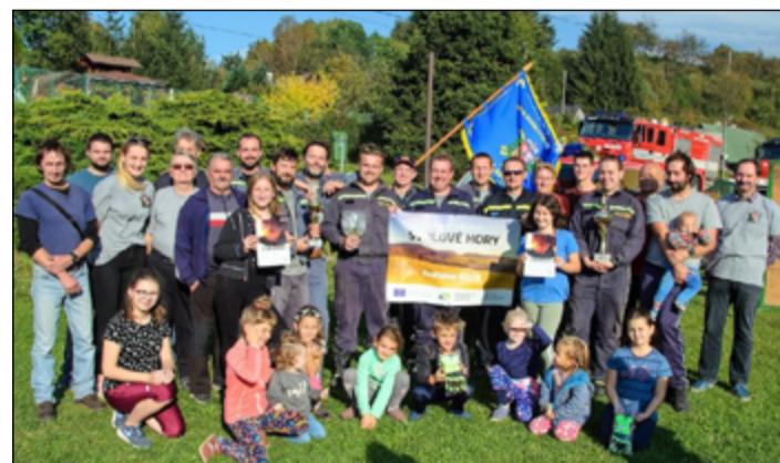
Hasičskou komunitu podporuje MAS Stolové Hory.