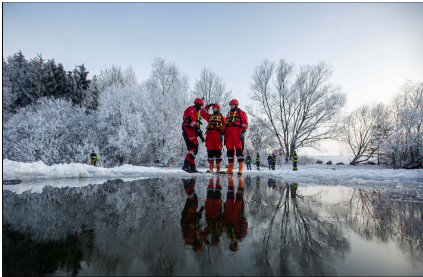
Nechod Vašku s pány na led... varuje jedno české přísloví. Hrozí uklouznutí, zlomeniny, prобоění. Snad jen s hasičským jištěním za zády.

Předávání titulu Zasloužilý hasič, Příbryslav