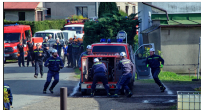
V Hlavňově mají hasiči dlouhou tradici.