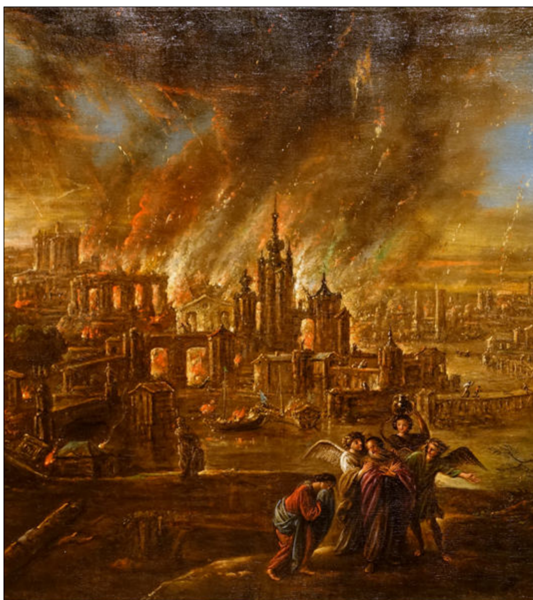
Zkáza Sodomy a Gomory byla možná popisem střetu Země s asteroidem.