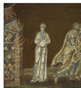
Biblický příběh Lota a jeho ženy.