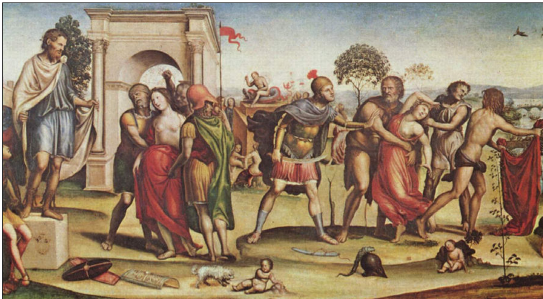
Města Sodoma a Gomora měla pykat za hříšnost jejich obyvatel.