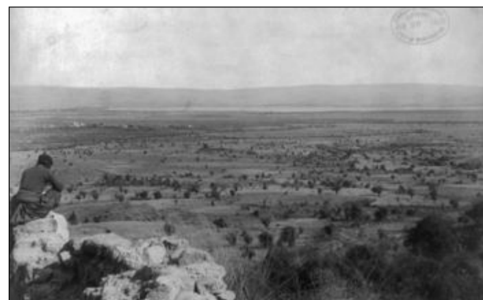
Biblická krajina na historické fotografii.