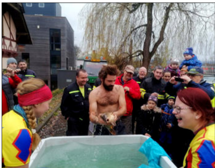
Vítěz soutěže čeká poslední úkol: vylovení kapra.

Jednou z tradičních soutěží v rámci okresu Liberec, která uzavírá soutěžní sezonu, je Vratslavický kapr. Probíhá po dobu více jak dvaceti let u hasičské zbrojnice ve Vratslavicích nad Nisou. Má svá pravidla, která se výrazně liší od pravidel požárního sportu, neboť jde o soutěž úsměvnou a pohodovou, která uzavírá soutěžní rok.