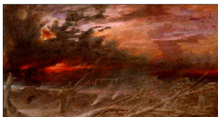
Zkáza krajiny na Blízkém východě jako motiv výtvarného díla.