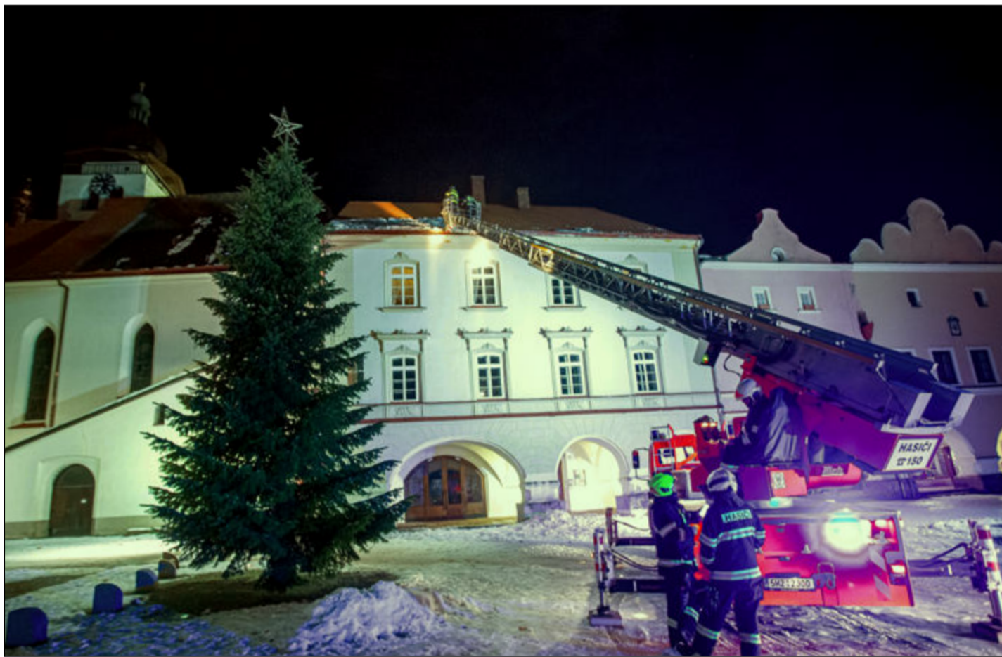
Vánoce, Vánoce přicházejí! Bohužel i občas hasiči přijíždějí...