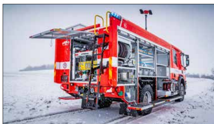
Obec Radonice v Ústeckém kraji je nyní vybavena novým zásahovým vozidlem CAS 20/4000/240 S2R na podvozku SCANIA P440. Hliníková nástavba vozidla je po celé délce opatřena výklopnými stupačkami!