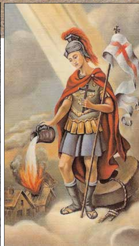
Tradiční vyobrazení sv. Floriána.

Na tomto principu sestrojené hasičské stříkačky se objevovaly i v prvních hasičských útvech ve starověkém Římě, kde ve spojení s hadicemi představovaly ty poslední „výstřelky“ hasičské techniky. Rovněž se v antice uplatnila i Ktésibiem definovaná technická řešení čerpání vody ze studní. V porovnání s dnešními pumpami byla kapacita těchto starověkých čerpadel žalostná. Pořád to však byl obřím pokrok v porovnání s klasickým vědrem zavěšeným na rumpálu. Tyto zázraky antiky byly na více než na patnáct století bohužel zapomenuty a čekaly na svoje složité znovuoobjevování.