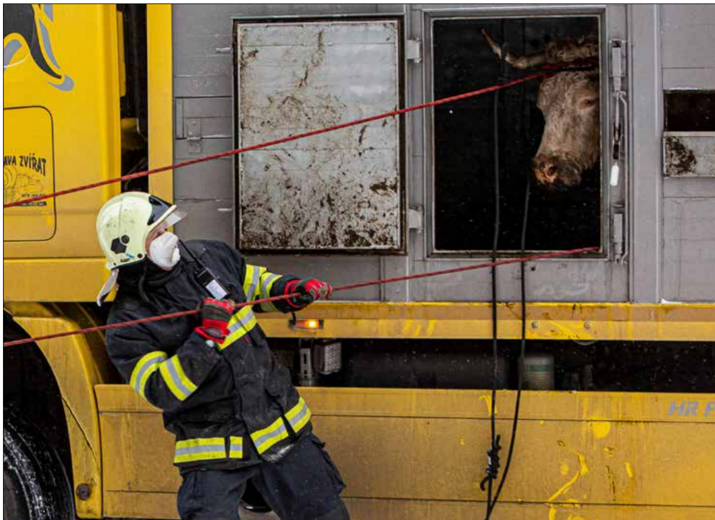
Hasiči jako krotitelé nejen červeného kohouta, ale i tvrdohlavého skotu.

Nový automobil Volkswagen Crafter pomáhá nyní dobrovolným hasičům ve Zděchově (okres Vsetín, Zlínský kraj). Polovinu celkových pořizovacích nákladů, které činily cca jeden a půl milionu korun, pokryly dotace Zlínského kraje a Ministerstva vnitra ČR. Zbytek částky zaplatila obec Zděchov. Automobil je osmimístný a sloužit bude zejména k dopravě osob. V nouzi najde využití i jako evakuační vozidlo. Zděchovští dobrovolní hasiči jsou zařazeni do páté kategorie jednotek požární ochrany.