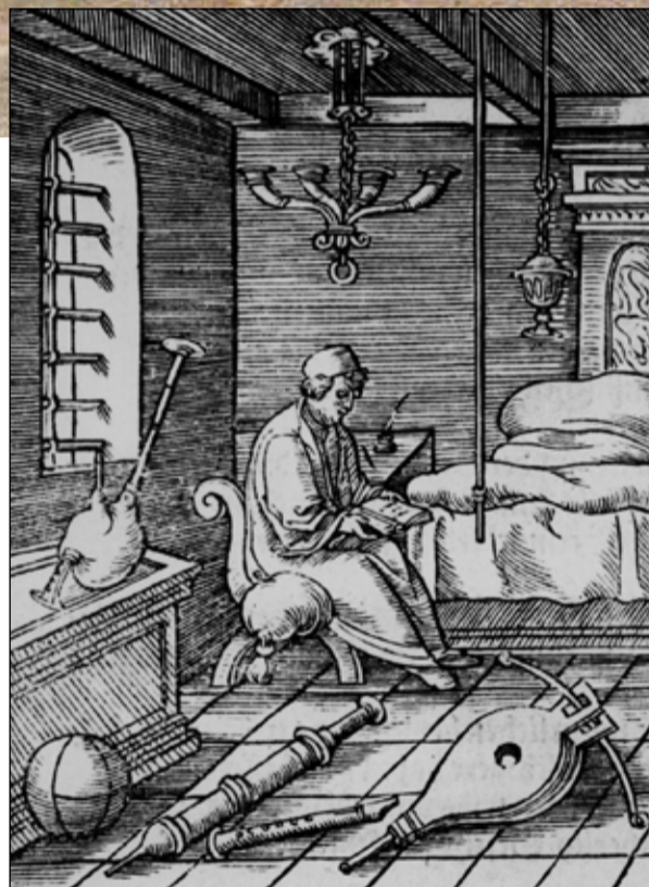
Středověká rytina s pohledem do pracovny vynálezce Ktésibia.