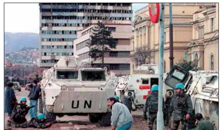
Bouřlivé časy občanské války po rozpadu jugoslávské federace.

Připravil Mirek Brát, zdroje foto: viječnica.ba, sarajevo.travel, flickr, youtube, wiki, pinterest