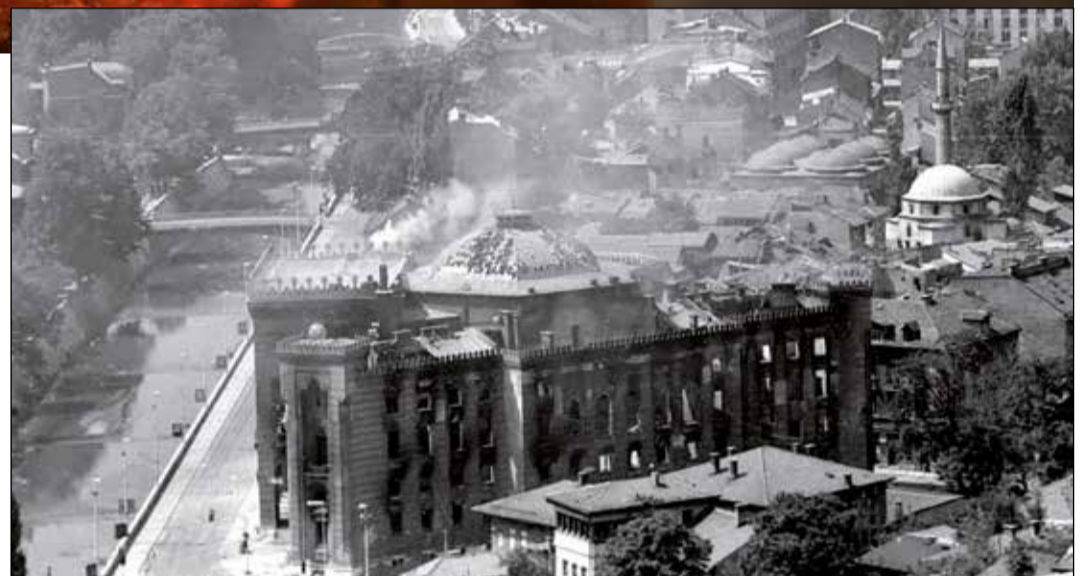
Rok 1992. Knihovna zničena dělostřelbou a požárem.

Obnova knihovny v Sarajevu trvala plných 22 let. Bylo to nesmírně dlouhý symbolický let bájněho Fénixe, který povstal z popela, aby se zrodil znovu, v ještě krásnější podobě. Podařilo se! Psal se rok 2014 a budova viječnice byla znovu slavnostně otevřena vystoupením Sarajevského filharmonického orchestru. Rekonstrukce knihovny si vyžádala značné finanční prostředky rozvržené do čtyřech etap rekonstrukce. První etapa proběhla v letech 1996–1997 a byla financována z daru Rakouské republiky. Rekonstrukční etapu z období 2000–2004 financoval dar Evropské komise a španělské Barcelony. Třetí etapa skončila v roce 2012 s celkovými náklady přes dva miliony eur. Čtvrtá a finální etapa rekonstrukce trvala 20 měsíců a stála přes 7 milionů eur. Bohužel, stále je zde trvalá ztráta