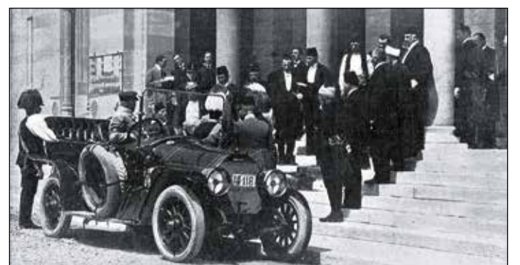
Vůz rakouského následníka trůnu Františka Ferdinanda d'Este parkuje u knihovny. Píše se rok 1914.