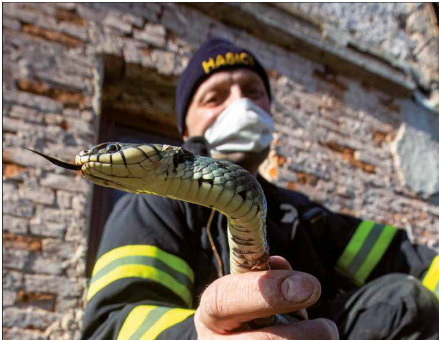
Je duben. To je měsíc, kdy na sv. Jiří vylézají hadi a štíři... I s tím si ale hasiči umějí poradit!