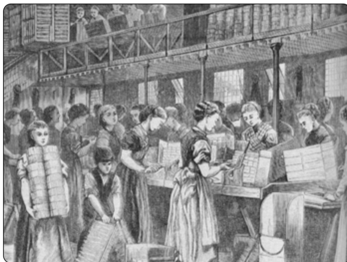
V továrnách na zápalky většinou pracovaly ženy.

bezpečnější, a to nikoli pouze z hlediska požární prevence. Podařilo se, bílý fosfor byl nahrazen červeným. Fosfor se rovněž přesunul z hlavice zápalky na škrťátko. Drsnost škrťátka moderní zápalky zajišťuje mleté sklo. Škrtnete a vytvoří se teplota dostatečná k zapálení hlavice zápalky i jejího dřívka napuštěného parafinem. I když hovoříme o bezpečnostní zápalkě, pamatujte, že někde ji stále vidíte „jako vlka v rouše beránčím“. Letecké společnosti například upozorňují, že v letadle můžete přepravovat na osobu pouze jednu krabičku zápalek. Navíc ji musíte mít u sebe a nikoli v palubním či odbaveném zavazadle. O tom, že stále platí, že zápalky nepatří do rukou dětem ani pyromanům, netřeba se obšírněji rozepisovat.