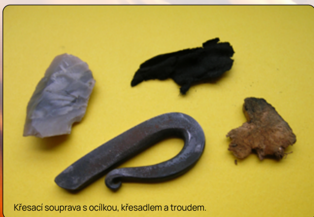
Křesací souprava s ocílkou, křesadlem a troudem.