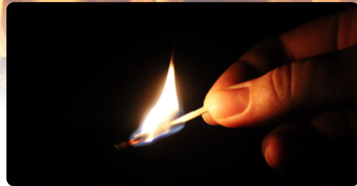
Teplota plamene hořící zápalky může dosáhnout až 800 stupňů Celsia.