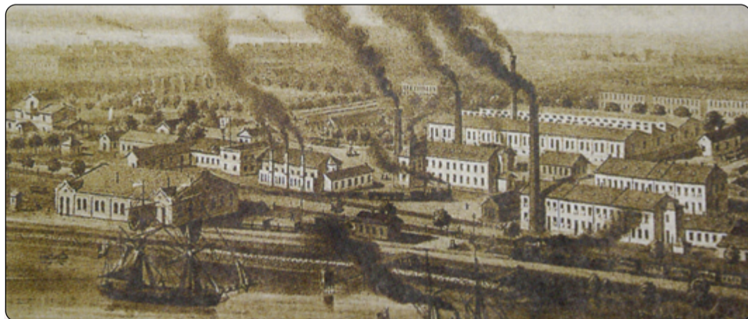
Továrna na výrobu zápalek ve švédském Jönköpingu v roce 1872.