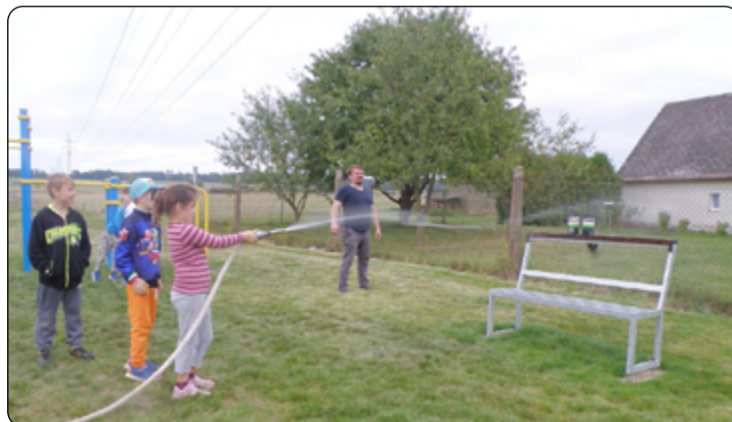
Co se v mládí naučíš...