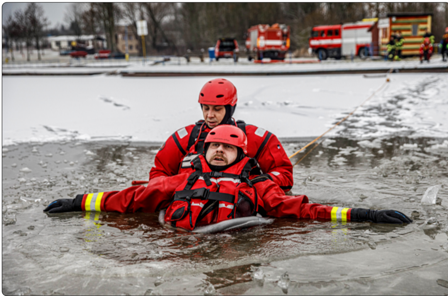
Mrázivé počasí je ideální pro nácvik záchran na zamrzlých vodních plochách.