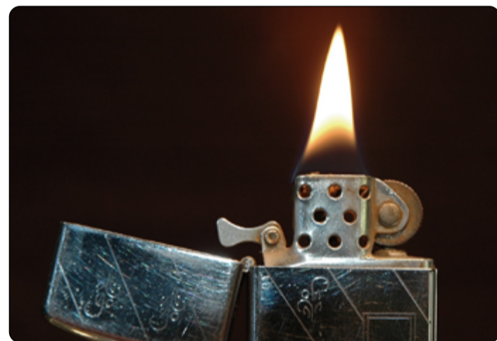
Vývoj zapalovačů akceleroval v době první světové války.