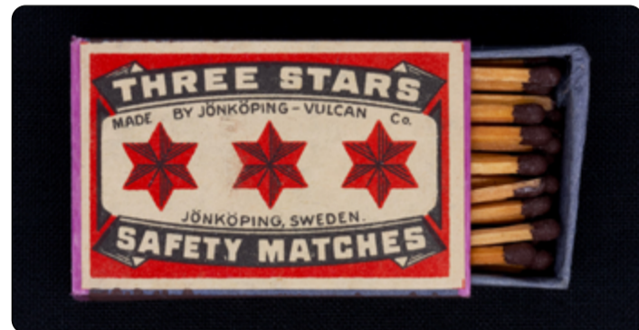
„Tři hvězdy“ byla obchodní značka švédských zápalek.