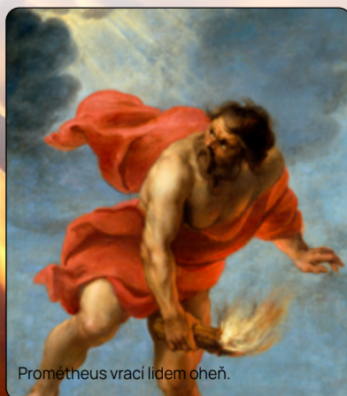
Prométheus vrací lidem oheň.