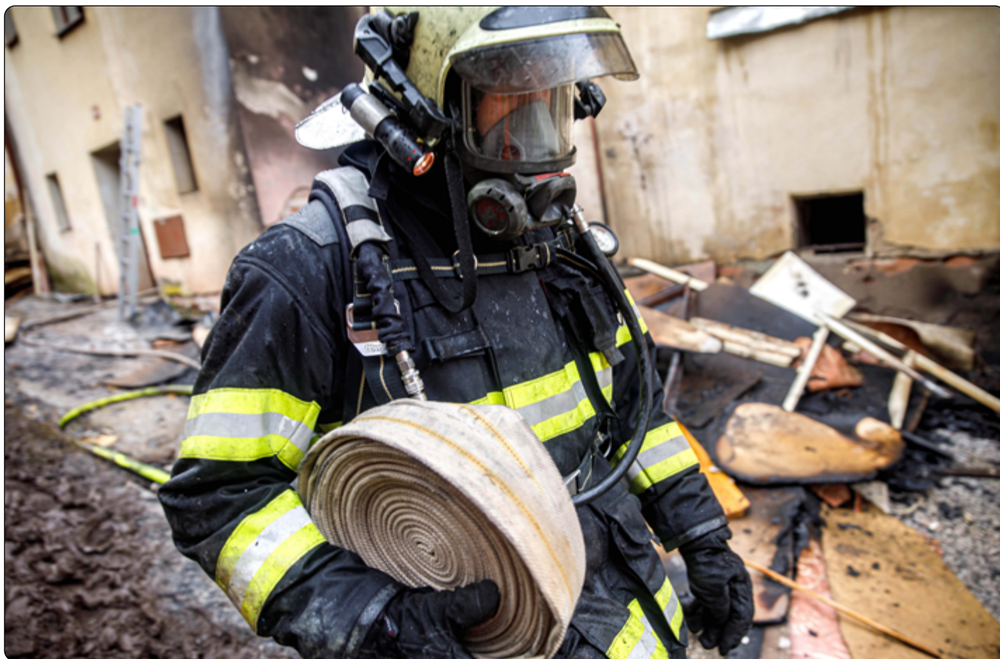
Hasičina je (hodně často) tvrdá dřina!