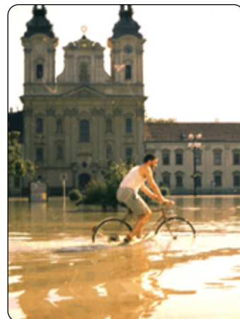
Povodeň vtrhla do měst.

plány ochrany před povodněmi, nebyly dostatečně stanoveny požadavky na bezpečnost vodních děl, koryta mnoha řek byla neudržovaná. Zároveň se ukázala nutnost koordinace provádění záchranných a povodňových prací a zejména nutnost koordinace nasazování sil a prostředků složek integrovaného záchranného systému. Proto se tyto povodně nepochybně staly impulsem pro analýzu stávající legislativy a následně vypracování a přijetí řady zákonů a prováděcích předpisů k nim, s cílem sjednotit působnosti a pravomoci orgánů veřejné správy i práva a povinnosti právnických a fyzických osob při řešení problematiky ochrany před povodněmi, ale také při přípravě na mimořádné události, při provádění záchranných a likvidačních prací, při ochraně obyvatelstva, stejně tak jako při přípravě a řešení krizových situací.