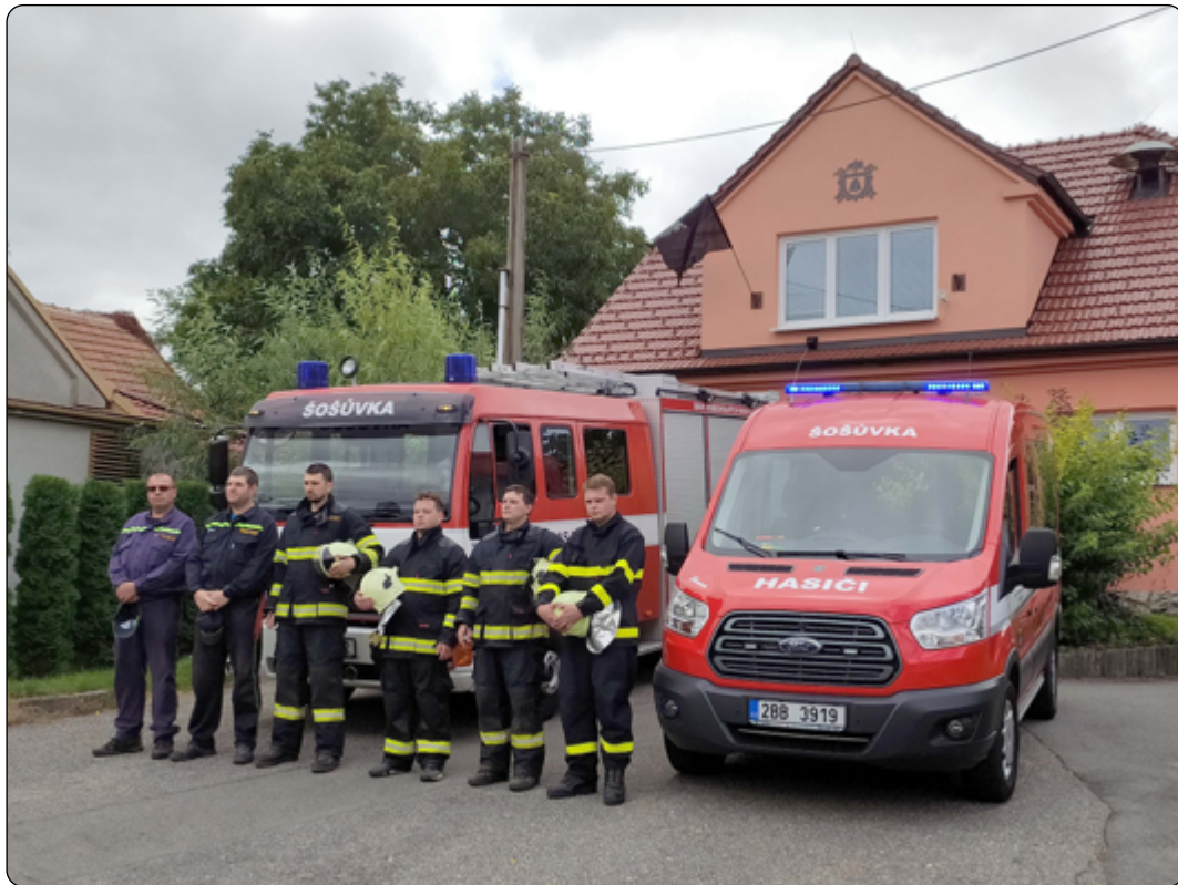
Pieta za hasiče, kteří zahynuli při výbuchu v Koryčanech.