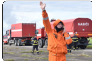
Stop! Vzbuřená voda.