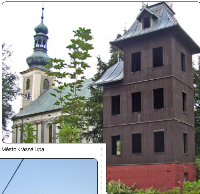
Město Krásná Lípa

Součástí staveb hasičských zbrojnic byly a jsou věže na sušení hadic. Samozřejmě, i ony se proměňují v čase. Dokumentují to i naše snímky z obcí Lánov, Rudník i města Krásná Lípa. Právě poslední jmenované město má na svém území hasičskou věž zapsanou do seznamu nemovitých kulturních památek naší republiky. Jedná se o unikátní technickou památku svého druhu, jedinou zachovalou část hasičské zbrojnice z 19. století.