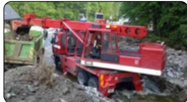
Úklid po velké vodě.