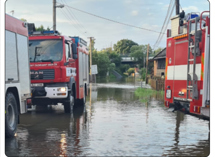
Vysoká brodivost hasičských automobilů je nutností.

mimořádných srážek byla před pětadvaceti lety tlaková níže, která se na naše území nasunula ze severu Apeninského poloostrova. Srážky byly opravdu mimořádné: za několik červencových dní spadla v povodí Odry a Moravy více než polovina ročního úhrnu srážek. Řeky Morava a Odra se rozvodnily na úroveň stopadesátileté až pětisetleté vody. Třetina Moravy a Slezska čelila katastrofální povodni. Neblahým symbolem povodni v roce 1997 se stala obec Troubky. Třetí povodňový stav byl na území České republiky odvolán až 29. července. Nastal čas velkého úklidu a sčítání škod. Bez nadsázky lze říci, že povodně v roce 1997 ovlivnily na postižených územích život celé jedné generace.