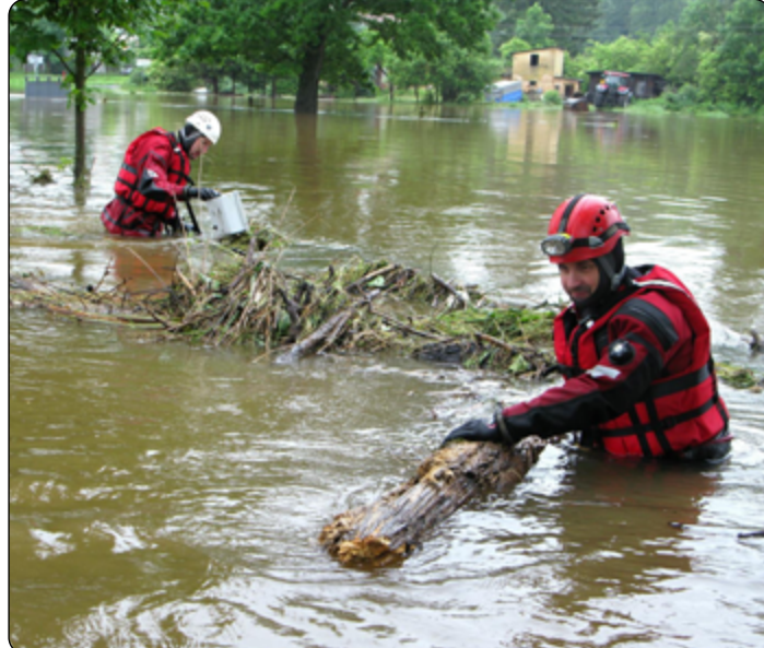
Hasiči musí být často "obojživelníky".

plány ochrany před povodněmi, nebyly dostatečně stanoveny požadavky na bezpečnost vodních děl, koryta mnoha řek byla neudržovaná. Zároveň se ukázala nutnost koordinace provádění záchranných a povodňových prací a zejména nutnost koordinace nasazování sil a prostředků složek integrovaného záchranného systému. Proto se tyto povodně nepochybně staly impulsem pro analýzu stávající legislativy a následně vypracování a přijetí řady zákonů a prováděcích předpisů k nim, s cílem sjednotit působnosti a pravomoci orgánů veřejné správy i práva a povinnosti právnických a fyzických osob při řešení problematiky ochrany před povodněmi, ale také při přípravě na mimořádné události, při provádění záchranných a likvidačních prací, při ochraně obyvatelstva, stejně tak jako při přípravě a řešení krizových situací.