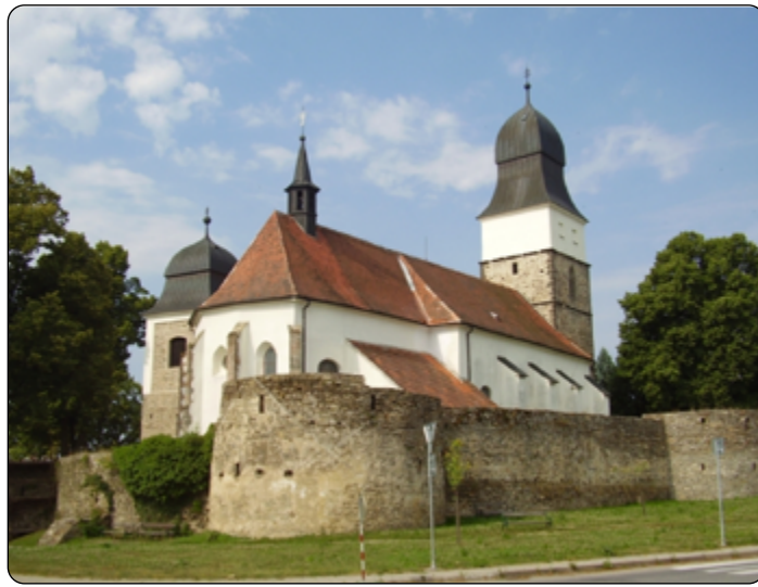
Velká Bíteš je město s dlouhou historií.

Mgr. David Dvořáček, Odborná rada pro historii OSH Žďár nad Sázavou, ilustrační foto Velká Bíteš, zdroj: Lukáš Bocan, CC BY-SA 3.0 < http://creativecommons.org/licenses/by-sa/3.0/ >, via Wikimedia Commons