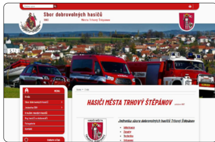
Úvodní strana webu

V dnešním čísle Hasičských novin se v padesátém druhém dílu naší pravidelné rubriky za hasičskou webovou prezentací vypravíme do města Trhový Štěpánov v okrese Benešov ve Středočeském kraji. Založení tamního hasičského sboru? Okresní hejtmanství v Benešově v závěru 19. století nařídilo, aby v každém větším městečku a obci byly utvořeny hasičské sbory. A tak po předchozích schůzích v roce 1882 se schází obecní zastupitelstvo, aby ze svých řad zvolilo a ustavilo spolek „Sbor dobrovolných městských hasičů v Trhově Štěpánově.“ Ve sboru musí být občané bezúhonní, opravdu čestní lidé města Štěpánova. V hostinci u Hulíků se 30. ledna 1883 ve 2 hodiny odpoledne zakládá „Sbor dobrovolných městských hasičů v Trhově Štěpánově.“ O 139 let později se můžeme s dobrovolnými hasiči seznámit i prostřednictvím jejich webu, který funguje na zabezpečené doméně prvního řádu. Web je velmi graficky přehledný a vzhledně aktualizovaný. Líbila se nám sekce s detailním popisem zásahů i možnost přepínání vzhledu webové prezentace například při zobrazení na displeji mobilního telefonu. Využití rychlého odkazu vám umožní okamžitě nahlédnout do zásahů JSDH i aktualit SDH, máte tak dobrý přehled o činnosti sboru i jednotky. Potěšující je samostatný odkaz věnovaný práci s mládeží. Dlouhou tradici má v Trhově Štěpánově „Den hasičů a záchranářů“. Nepřekvapí tak, že tato akce má na webu svůj samostatný odkaz.