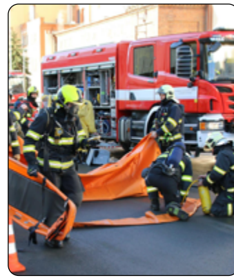
HZS Plzeňského kraje

V únoru proběhlo prověřovací cvičení na únik čpavku z technologie v Plzeňském Prazdroji. Akce se zúčastnily jednotky ze stanic Střed, Košutka a JSDH podniku Plzeňský Prazdroj. Podobná cvičení ve spolupráci s pivovarem pořádá HZS pravidelně. S dokumentováním cvičení pomáhalo družstvo dronů SIT MP (správa informačních technologií města Plzně), jež je součástí IZS a vyjíždí jako součást JSDH Plzeň Litice.