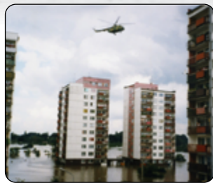
Povodeň v polské Wroclawi.