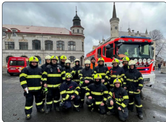
Vichřicové komando SDH Zákupy.