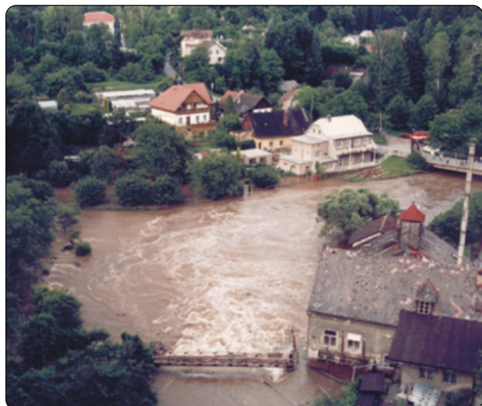
Síla povodně z ptáčích perspektivy.

často v kombinaci s dešťovými srážkami; tyto povodně zasahují nejčastěji podhorské vodní toky a při rozsáhlejším oteplení v kombinaci s dešti zasahují i velké nížinné vodní toky, specifickým typem jsou povodně způsobené ledovými jevy na vodních tocích v zimním období způsobené ledovými nápechy nebo zácpami, které mohou vzniknout na vodních tocích všech kategorií; intenzitu povodně určují kombinace místních podmínek v korytech vodních toků a výskytu přírodních meteorologických jevů (dlouhá mrazová období střídaná teplotními inverzemi nebo prudkým oteplením). Mezi zvláštní povodně jsou řazeny povodně způsobené umělými vlivy, tj. situacemi, které mohou nastat při stavbě nebo provozu vodních děl, při narušení vzdouvacího tělesa, při poruše hradičích konstrukcí výpustných zařízení, nebo při řešení kritických situací z hlediska bezpečnosti vodních děl.