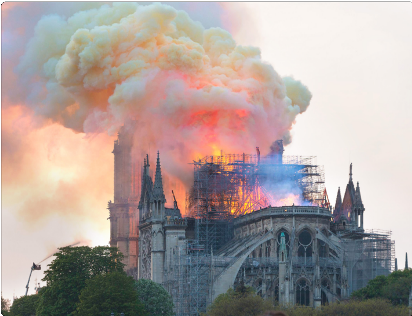
Požár začal 15. dubna 2019

spěšně evakuovala ostrov Ile de la Cité, kde se katedrála nachází. Lidé se však okamžitě shromáždili na březích řeky Seiny a v okolních budovách, ze kterých celý výjev pozorovali. Většina požáru byla uhašena kolem 23.30 a zcela uhašen byl až následující den v ranních hodinách. S požárem hasiči bojovali přibližně 12 hodin. Náčelník pařížských hasičů uvedl, že pokud by požár trval o 30 minut déle, zvonice a část zdi by se nejspíše zřítily. Požár se v souladu s běžnou praxí francouzských hasičů hasil primárně zevnitř. Kvůli hašení zvnějšku katedrály by mohlo dojít k poškození interiéru, protože by se plameny a plyny o vysoké teplotě (dosahující až 800 °C) mohly odrazit směrem dovnitř. Do hlavních dvou věží vstoupilo na dvacet hasičů. Hasičská vozidla s vysokotlakými vodními děly opatrně hasila požár a snažila se vyhnout dalšímu poškození budovy. Dle nouzového plánu se na řeku Seinu vypravily dvě lodě jako součást dálkové dopravy vody. Jakékoliv provedení hašení ze vzduchu bylo ihned odmítnuto. Váha vody a její shazování z nízké výšky by mohlo výrazně ohrozit konstrukci katedrály. Zároveň vápenec, který je součástí konstrukce, mohl působením žaru a následného prudkého ochlazení vodou prasknout. Kvůli stoupajícímu kouři bylo taktéž upuštěno od hašení z helikoptéry. Situaci ovšem monitorovaly drony vybavené termokamerami.