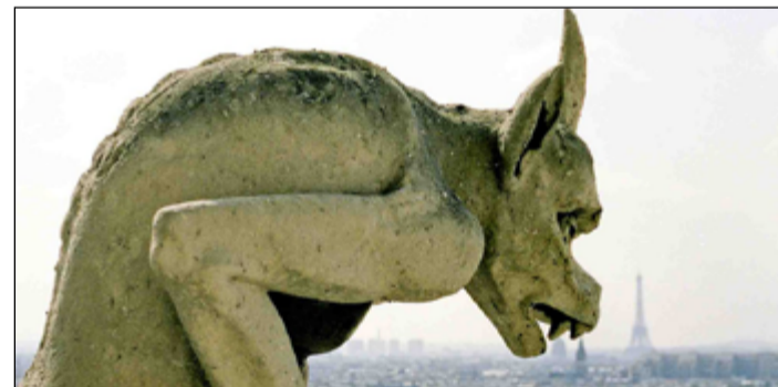
Dábelské prvky výzdoby katedrály se mohly z požáru radovat..