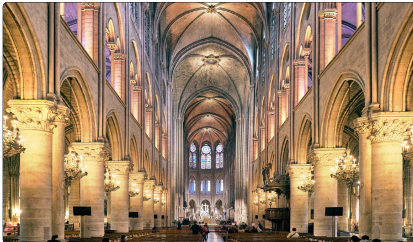
Vnitřní prostory katedrály Notre-Dame

Zdroje textu: wikipedia, zdroje foto: Antoninnnn, CC BY-SA 4.0 < https://creativecommons.org/licenses/by-sa/4.0/ >, via Wikimedia Commons. Waterced, CC BY-SA 4.0 < https://creativecommons.org/licenses/by-sa/4.0/ >, via Wikimedia Commons. GodefroyParis, CC BY-SA 4.0 < https://creativecommons.org/licenses/by-sa/4.0/ >, via Wikimedia Commons. Cayobo from Key West, The Conch Republic, CC BY 2.0 < https://creativecommons.org/licenses/by/2.0/ >, via Wikimedia Commons. Bertrand from Paris, France, CC BY 2.0 < https://creativecommons.org/licenses/by/2.0/ >, via Wikimedia Commons. Cornellier at English Wikipedia, CC BY-SA 3.0 < https://creativecommons.org/licenses/by-sa/3.0/ >, via Wikimedia Commons. Maximilien Luce, Public domain, via Wikimedia Commons. Work by Rama, C BY-SA 2.0 FR < https://creativecommons.org/licenses/by-sa/2.0/fr/deed.en/ >, via Wikimedia Commons