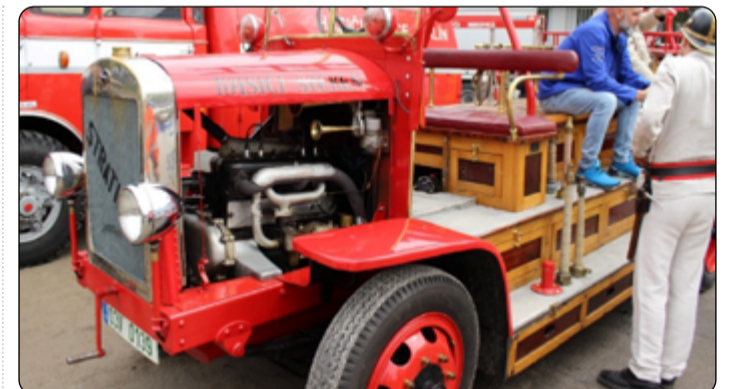
Krása hasičských automobilů časů minulých