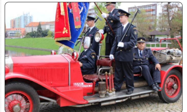
Historická tatra z roku 1927