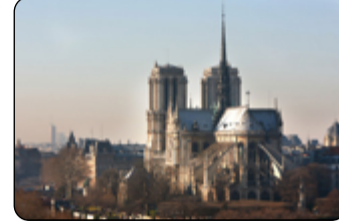
Katedrála je ikona Paříže

Požár katedrály Notre-Dame v Paříži vypukl v prostoru její střechy během rekonstrukce v pondělí 15. dubna 2019 (pondělí Svatého týdne) večer, zcela uhašen byl požár v úterý 16. dubna ráno, po zhruba 12 hodinách. Požár zničil téměř celou střechu včetně typického sanktusníku, část vitrážových oken a část nosných kleneb v chrámové lodi. Spolu s následky hašení také částečně poškodil vnitřní vybavení, většina vzácných artefaktů však byla zkázy ušetřena.