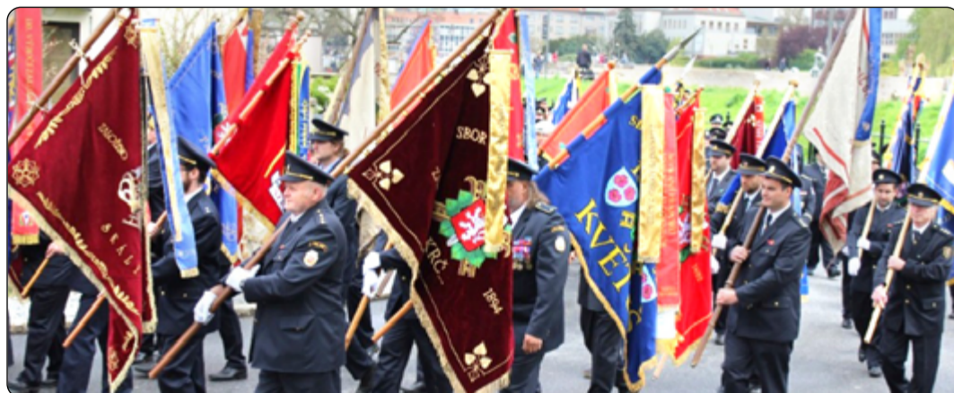
Slavnostní pochod s prapory