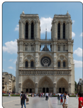
Katedrála jako cíl turistů