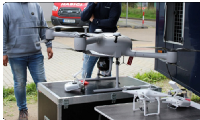
Prezentace bezpilotního letounu - dronu