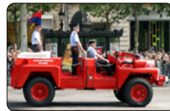
Defilé pařížských hasičů