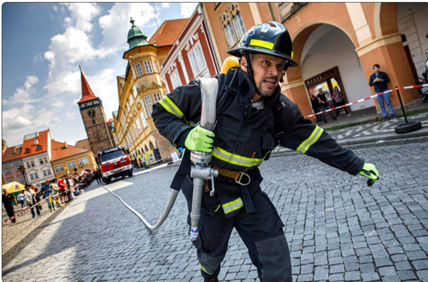
Hasičina je dřina! Dokládá to i snímek z nedávné akce TFA Jičín.