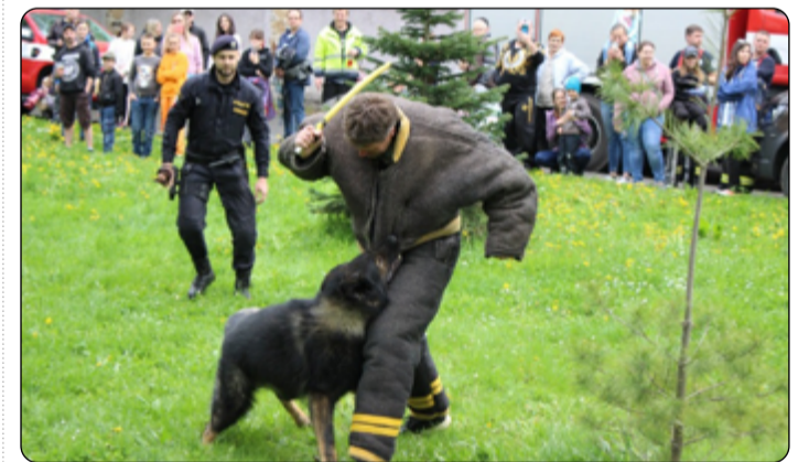
Policejní pes v akci aneb police "cení zuby"