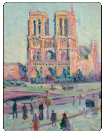
Katedrála jako inspirace malířů