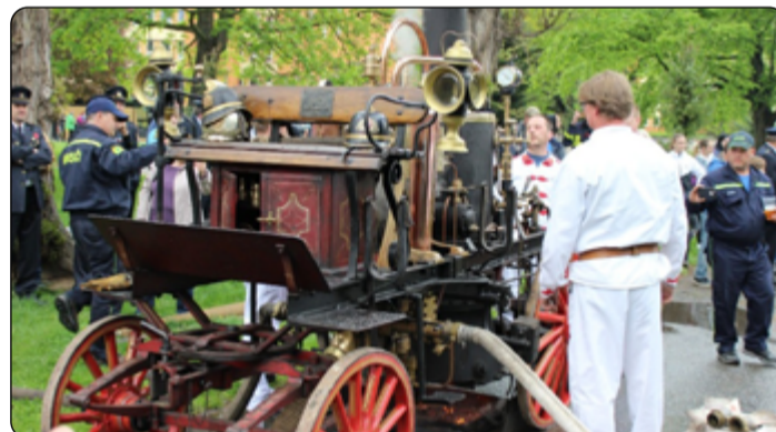
Historická stříkačka - je stále funkční