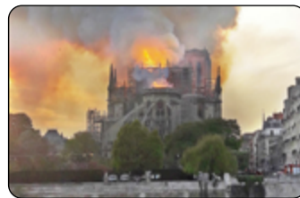
Notre-Dame v plamenech

V minulém čísle Hasičských novin jsme vás pozvali do kin na nový snímek režiséra Annauda s názvem Notre-Dame v plamenech. Pro ty z vás, kteří se do kinosálu nechystají, jsme připravili malé ohlédnutí za katastrofou, která postihla ikonický francouzský svatostánek před třemi lety.