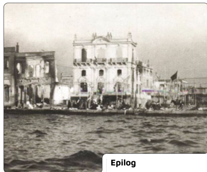
Oheň město zpusťořil.