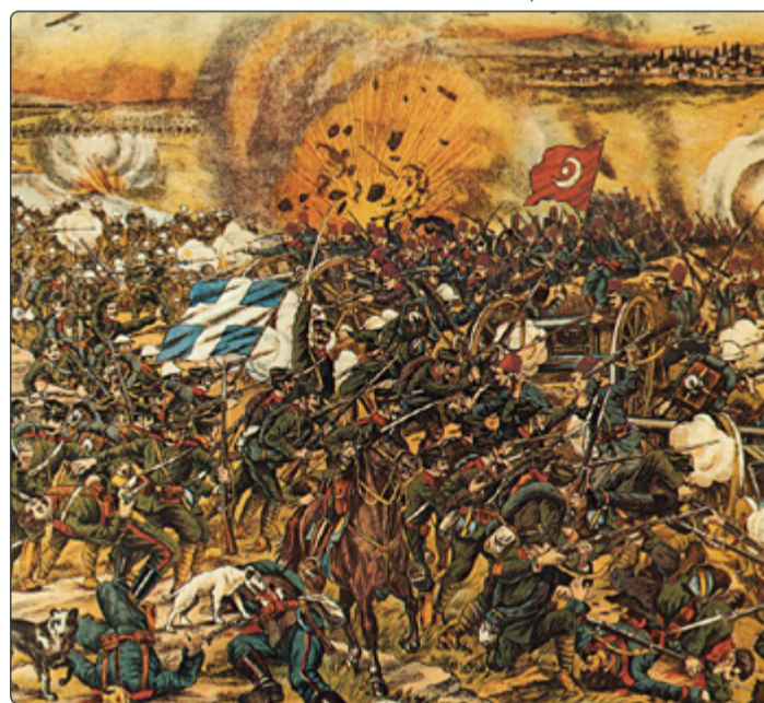
Recko válčilo s Tureckem již v 19. století.