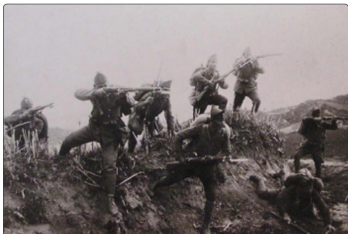
Útočící řecká pěchota.