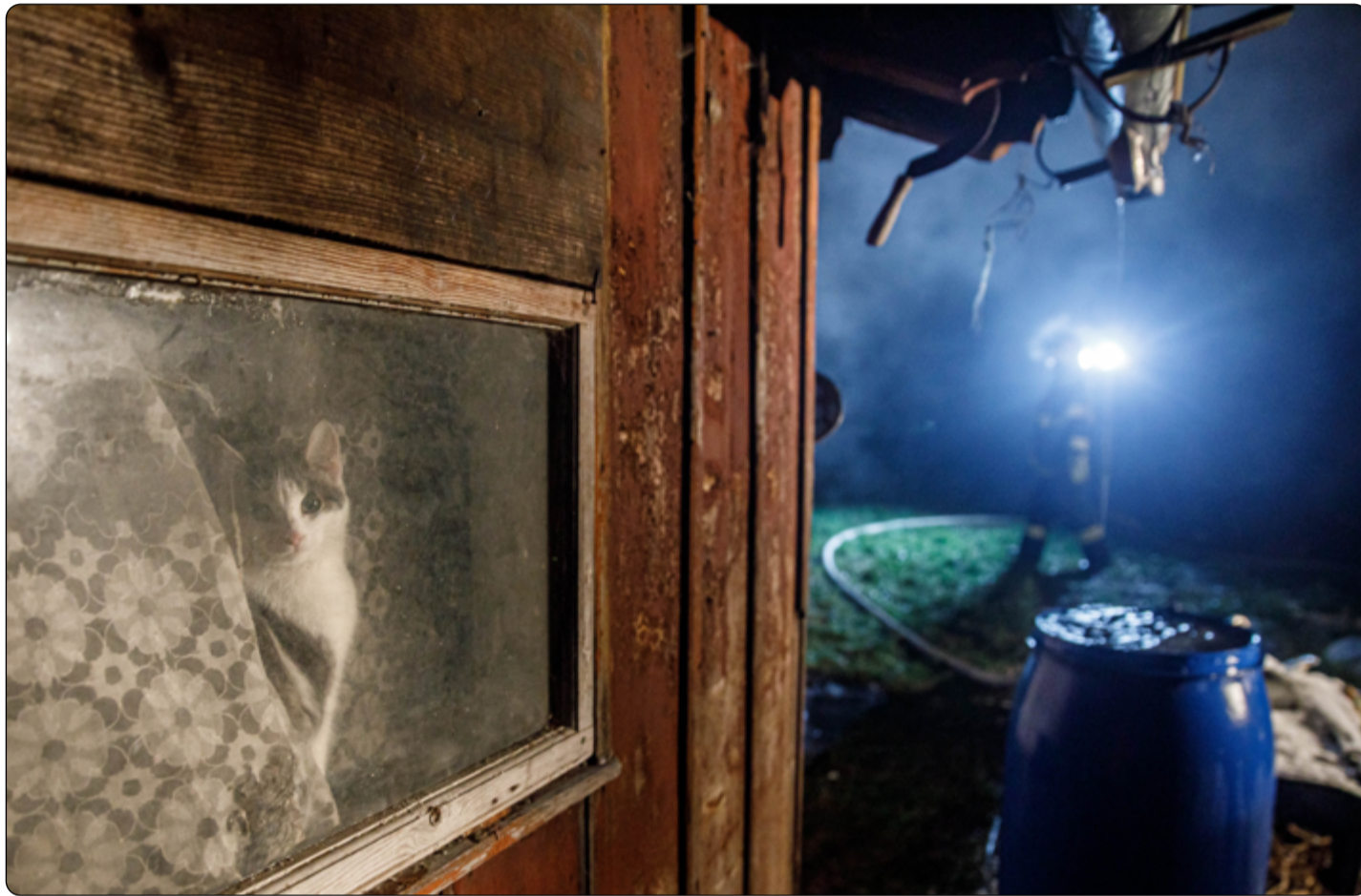
Možná ani nevíme, kdo všechno v nouzi na hasiče spoléhá... (snímek ze zásahu u požáru drážního domku v Jesenice)

Vážení a milí čtenáři Hasičských novin, dovolte mi, abych Vás pozdravil v novém roce 2022. Hasičské noviny vstoupily již do 33. ročníku své existence. I pro tento rok jsme pro vás připravili 24 vydání Hasičských novin. Věříme, že v nich najdete zajímavé a užitečné informace o hasičích a pro hasiče. Rád bych poděkoval všem, kteří již uhradili předplatné novin pro rok 2022. Přeji vám, aby rok 2022 byl, pro vás a vaše nejbližší, obdobím úspěšným a klidným, aby v něm nechyběla nejen pozitivní nálada a zdraví, ale i odvaha, trpělivost, empatie, solidarita a další žádáně lidské ctnosti, které nám pomáhají povýšit pouhou existenci na smysluplný a naplněný život. Za redakci Mirek Brát