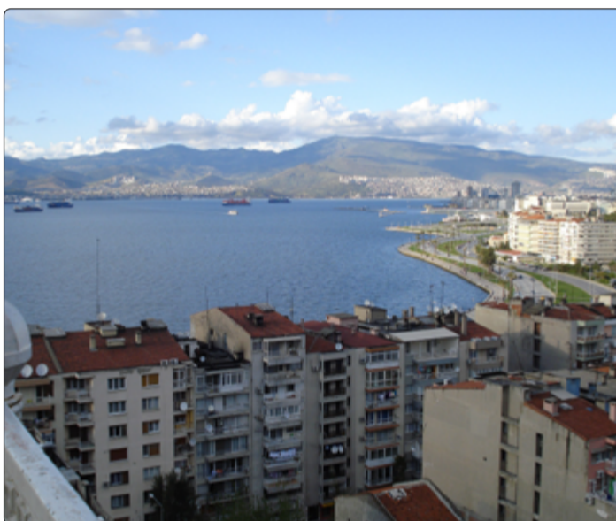
Smyrna byla později přejmenována na Izmir.