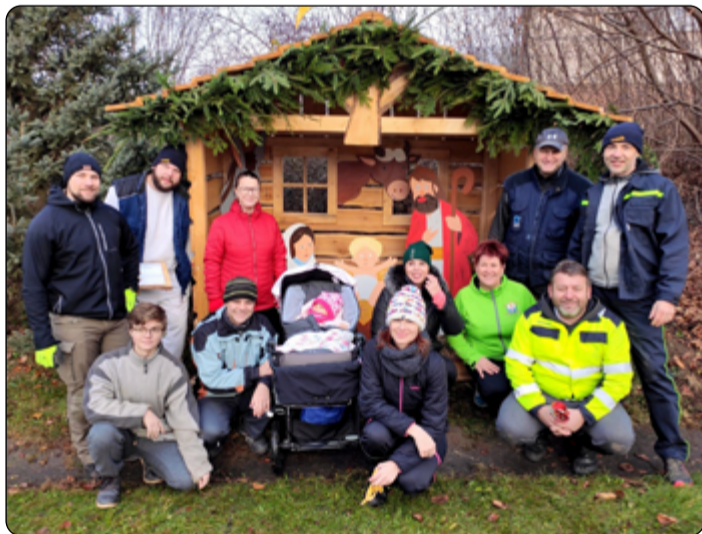
Zastavení vidovských hasičů na betlémské cestě.