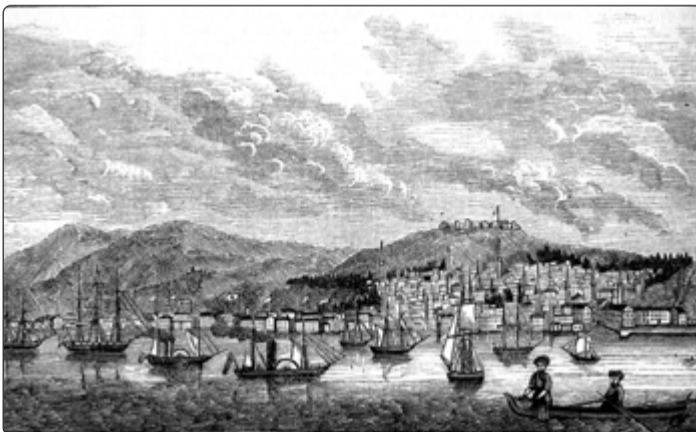
Historické vyobrazení Smyrny.