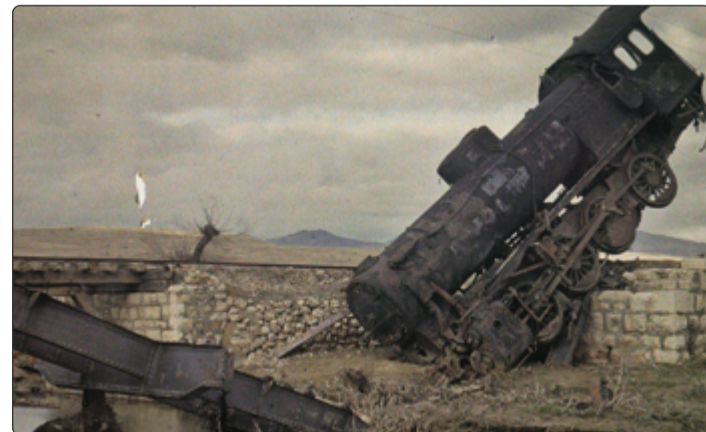
Recko-turecká válka přinesla zkázu i do civilizační infrastruktury.