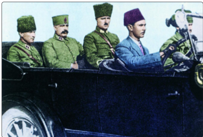
Turecká generálita přijíždí do Smyrny.