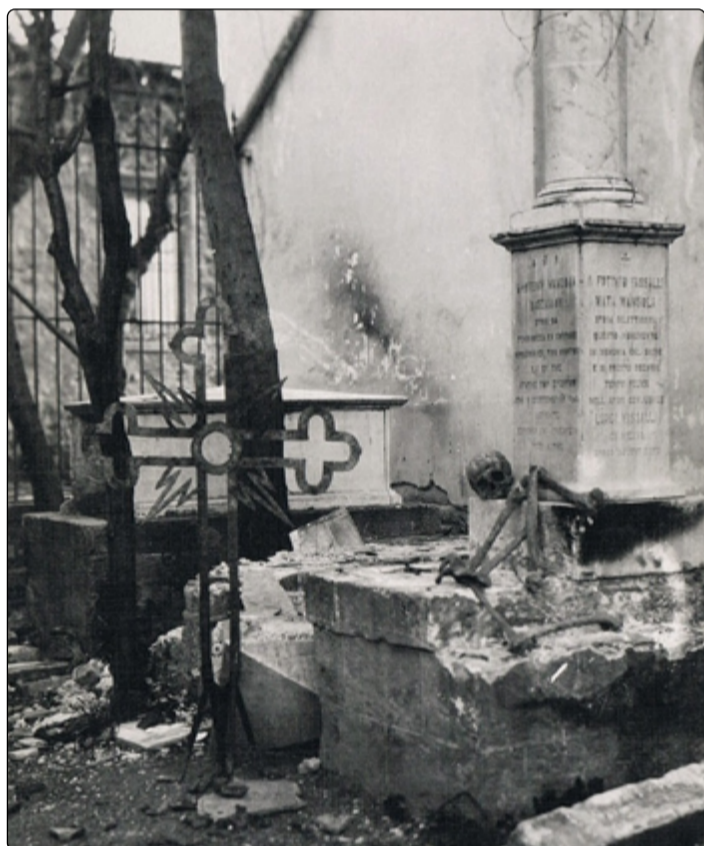
Zhanobený křesťanský hřbitov ve Smyrně.